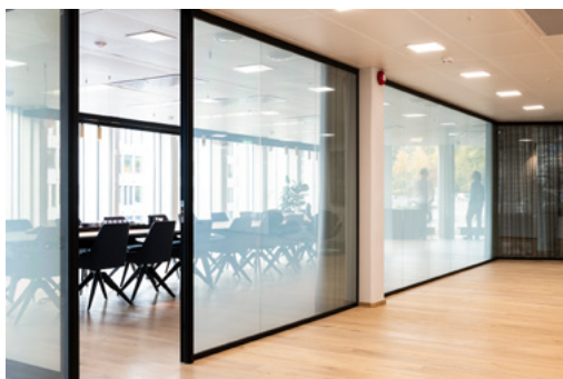
Fra korridoren utenfor Dronning Maud Land er glassveggen transparent når møterommet ikke er i bruk. Dette gir utsyn til de grønne trærne i Slottsparken, og til 7. Juniplassen. Når møterommet er i bruk aktiveres den elektriske folien i glasset.