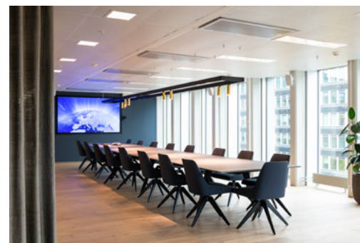
Rommet er utformet for å kunne fungere til både representasjonsmiddager og større møter. Det har vært viktig å finne møbler som skaper en god balanse mellom funksjon, komfort og samtidig danner en trivelig ramme for middager.

gjenbrukt fra det gamle møtesenteret. Den ble demontert, modifisert i størrelse og reetablert i den nye etasjen. Her kom virkelig materialeegenskapene ved Corian til sin rett. Skjøter er sveiset usynlig sammen igjen, og det er ikke mulig å se spor av modifikasjonene. Gasspeisen med klebersten er også flyttet og fremstår i ny prakt som en del av helheten. Resepsjonsområdet benyttes som vringleområde i forbindelse med større kundearrangementer. Her kan det bli servert mat og drikke ved kveldsarrangement. Da kan resepsjonsdisken også benyttes som buffet. Vringleområdet er koblet direkte sammen med det store møterommet, Nansen. Det har sitteplass til 77 personer, og er bygget opp med et svakt amfi med klappstoler.