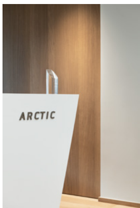
Resepsjonsdisken i hvit Corian ble gjenbrukt og har fått usynlige tilpasninger. Den lyser arktisk hvit og står i fin kontrast til det varme treverket.