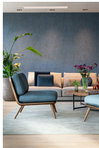
Loungen i Dronning Maud Land benyttes i forlengelse av middagene som jevnlig arrangeres her. Veggen er kledd med tapet, og plukker opp fargene i møbeltekstilene. Arctic har selv sørget for store planter og har alltid friske blomster rundt i lokalet.