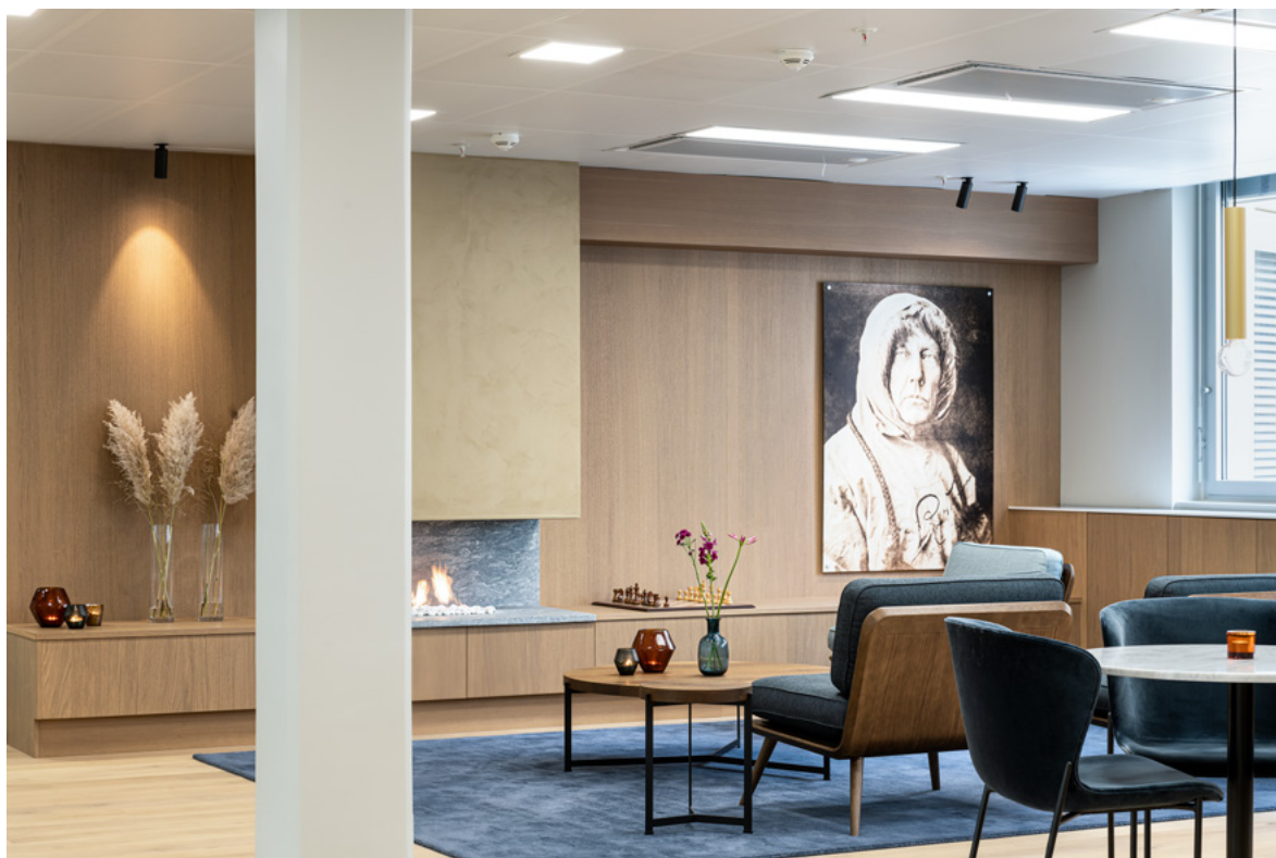
For å skape en lun atmosfære er veggen kledd i eik, og peisen integrert i denne. Utstrakt bruk av tre er med på å gi varme. Detaljer på disse er i røkt eik for variasjon.