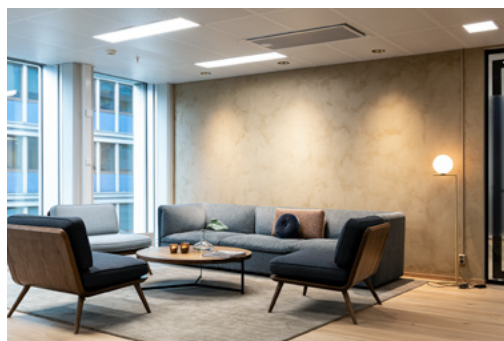
Lenger inn i møtesenteret, der interntrepp og interne heiser kommer ned, åpnes det opp mot fasaden for å slippe inn lys og skape rom i dette knutepunktet. Her ligger også en kaffestasjon som skaper et møtepunkt mellom interne og eksterne.