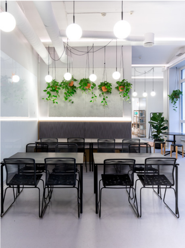
Veggene i lunsj- og workshop-arealet er designet for å kunne skrive og henge ting på.