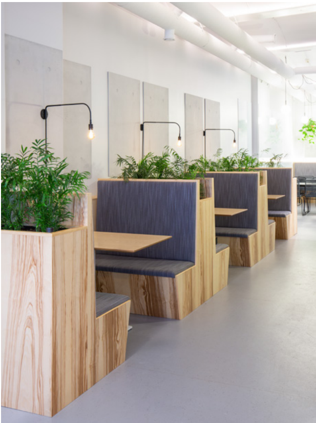
Små båser til å arbeide i skiller den åpne workshop-sonen og kantine og møteromsdelen.