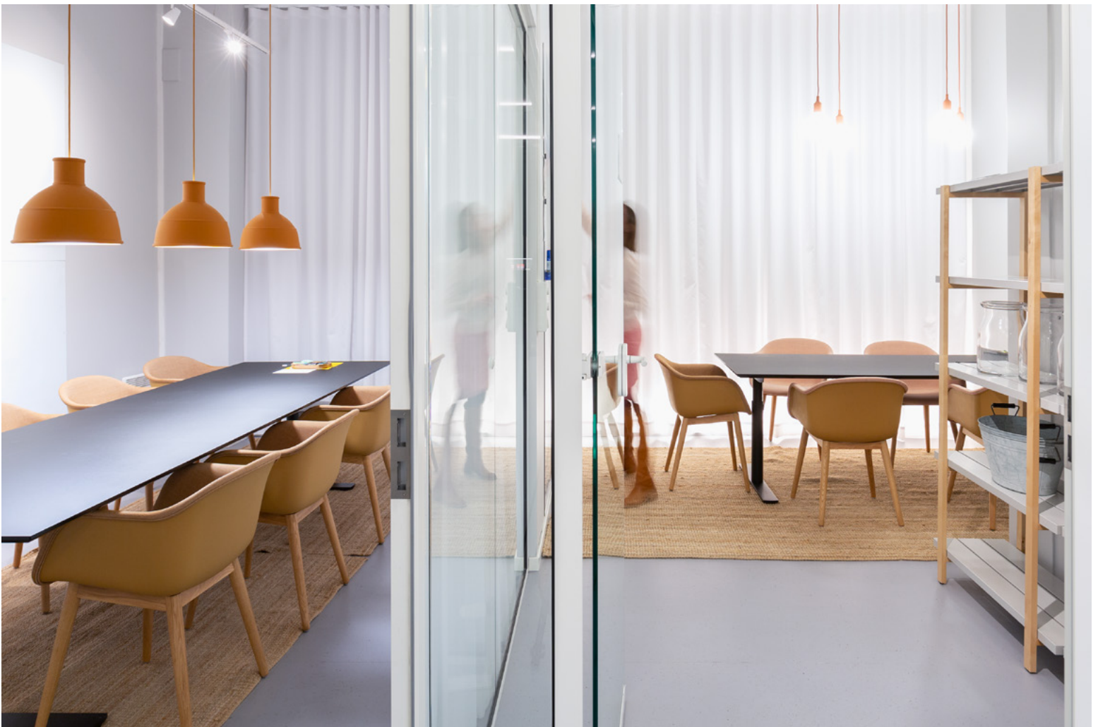
I møteromsavdelingen finner man ulike typer møblering for ulike aktiviteter. Gjennomgående for alle rommene er de lyssatte gardinene, fargede pendler og masse skriveflater på veggene. En bakllys-gardin i møterommet gir følelse av dagslys i det dype lokalet og gjør møterommene lyse og trivelige.