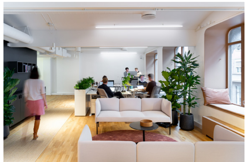
Fleksibelt lyst, og innbydende i kontoretasjene.