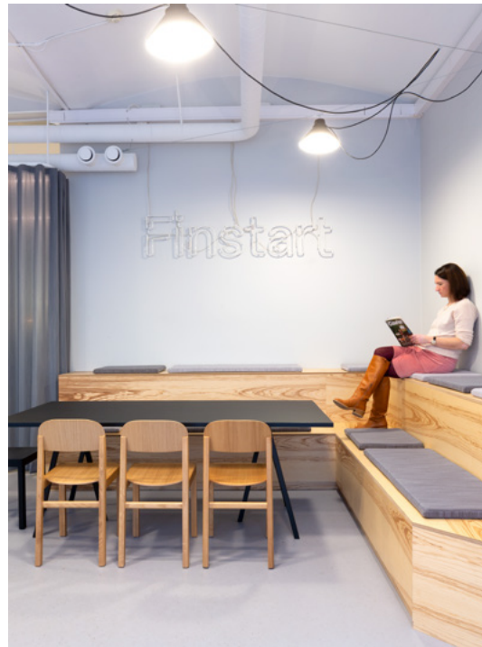
Amfiet gir plass til mange deltagere på konferanser og workshop og er et supert sted å ta morgenkaffen eller ha uformelle møter mellom jobbkøtene.