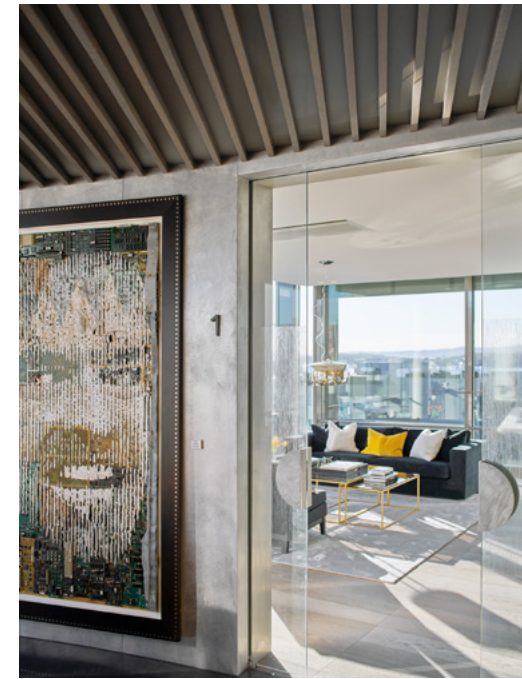
Lokalene skulle være moderne og fremtidsrettet, samt trivelig og hjemmekoselig.

Bindeleddet mellom åttende etasje, de eksisterende lokalene og toppetasjen, ble en stor spesialdesignet buet internttrapp i tre og glass. Veggene i trappehullet ble kledd