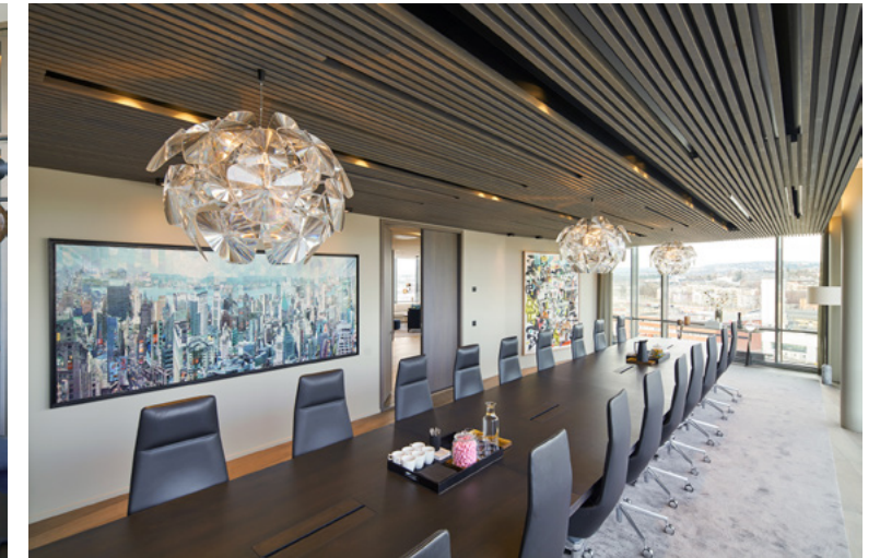
Myke og harde former og overflater.

med finerplater i full høyde, der platene ble montert forskutt med lys i overlappen mellom platene. Det samme prinsippet ble brukt på den buede vegg bak resepsjonen som skjuler kaffestasjon, oppbevaringsskap og kopirom. I senter av rommet når man kommer opp trappen er det en sirkulær lysinstallasjon med en diameter på ca. tre meter. Ut fra «sola» er spilehimlingen lagt som stråler, noe som understreker formen på rommet. Resepsjonsdisken følger også formen på rommet og er laget i en kombinasjon av tre og flis. Resepsjonen er avskjermet fra møteromsavdelingen med