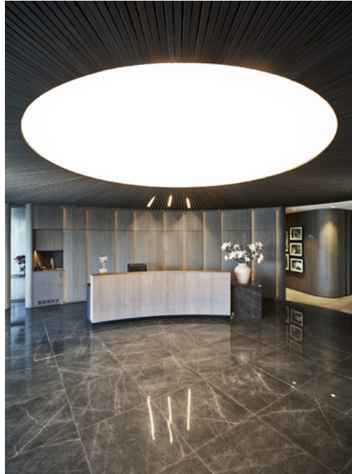
En buet vegg bak resepsjonen skjuler kaffestasjon, oppbevaringsskap og kopirom.