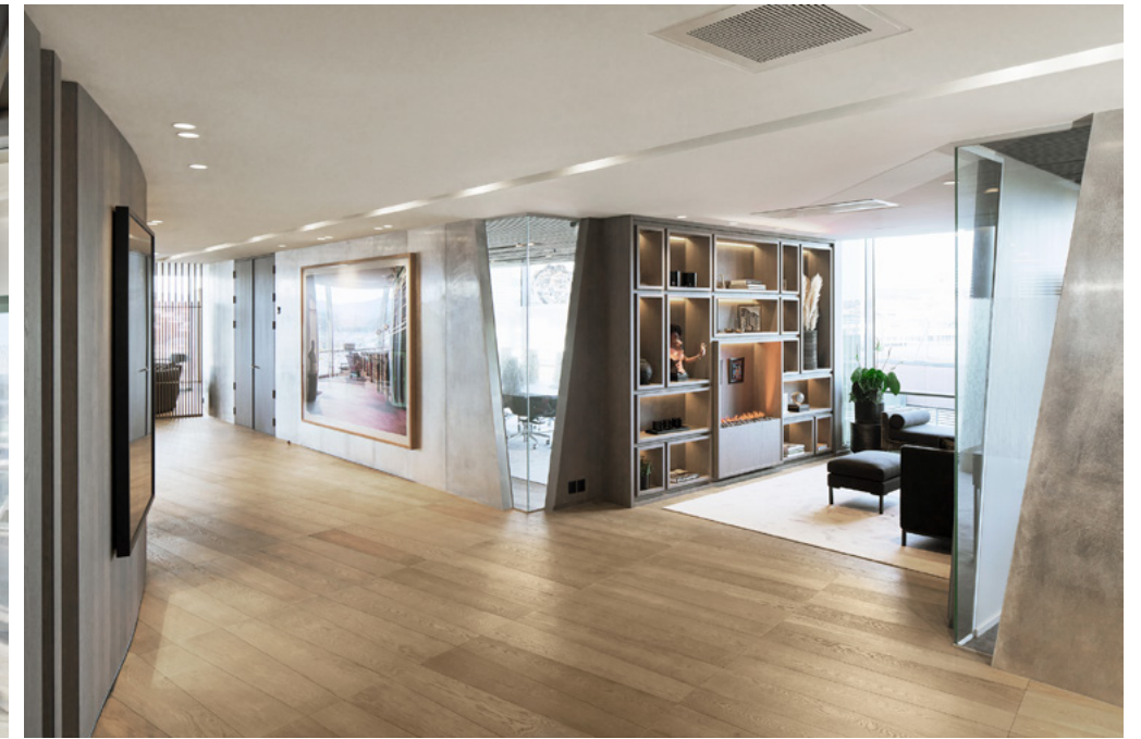
Alt fra veggkledninger i tre og aluminium, spesialdører i full høyde, bokhyller, spilevegger, baderomsmøbler, skjulte dører, og ikke minst spilehimlingene er spesialdesignet.