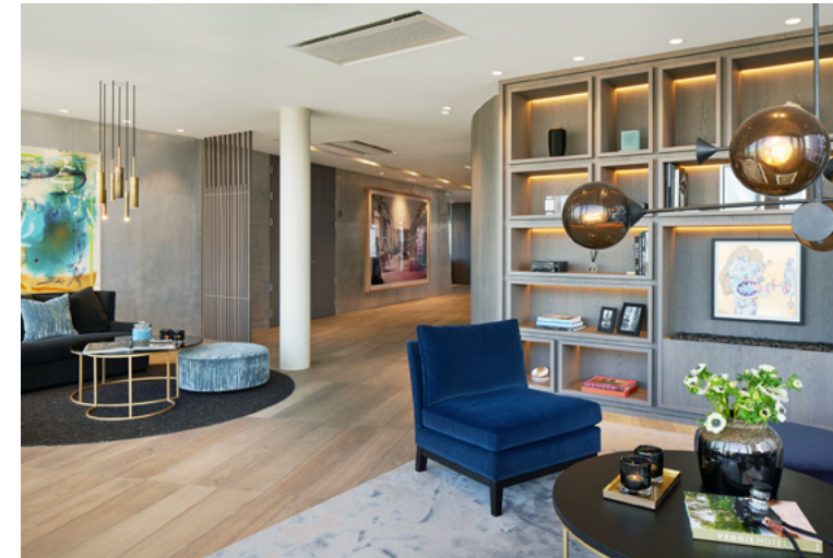
Pangea har oppnådd målet sitt om å få et av byens mest eksklusive coworkingarealer.