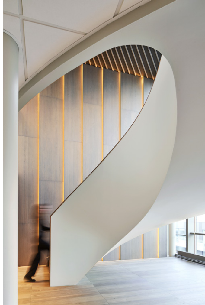
Bindeleddet mellom åttende etasje og toppetasjen ble en stor spesialdesignet, buet internttrapp i tre og glass.

PANGEA PROPERTY PARTNERS → OSLO AS SCENARIO INTERIØRARKITEKTER Prosjektansvarlig → Heidi Berg Edbo, interiørarkitekt MNIL KREDITERING → SIDE 225