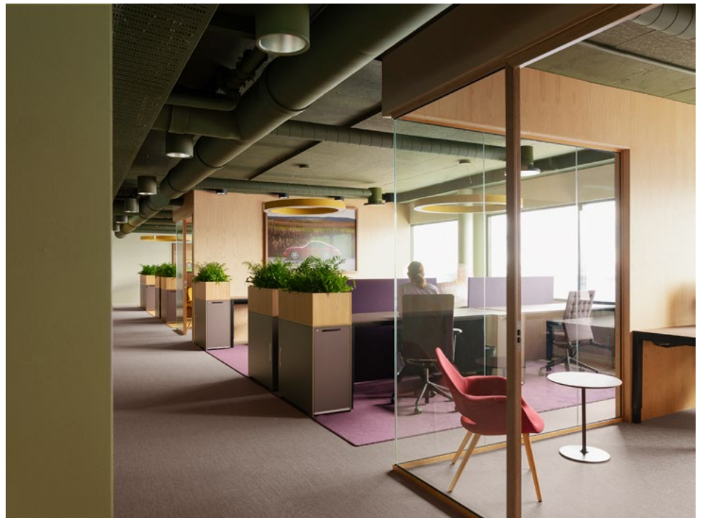
Team Lilla med teamleder-kontoret i forkant.