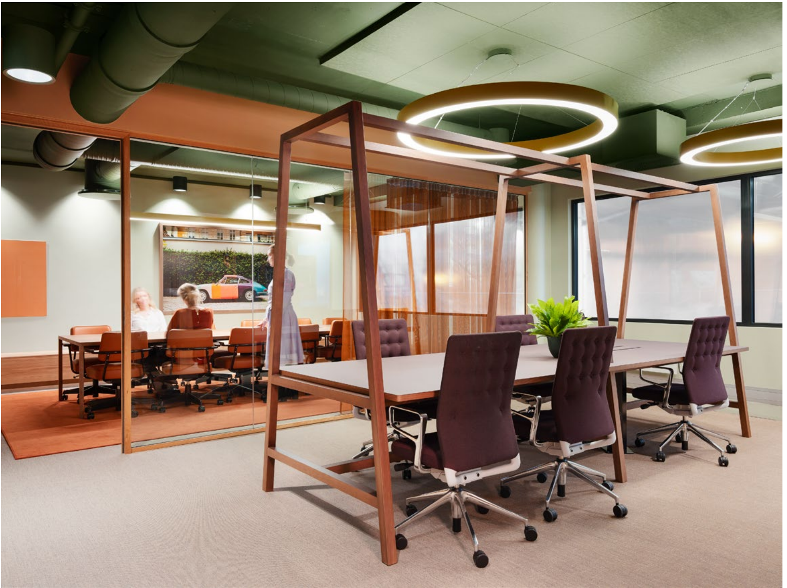
Styrommet, med en flerfarget Porsche-modell som inspirasjon. Drop in-plasser for gjester i forgrunnen.