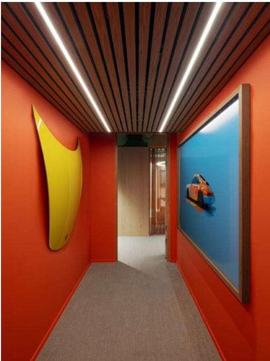
Rik fargepalett og bestandige materialer er gjennomgående valgt.