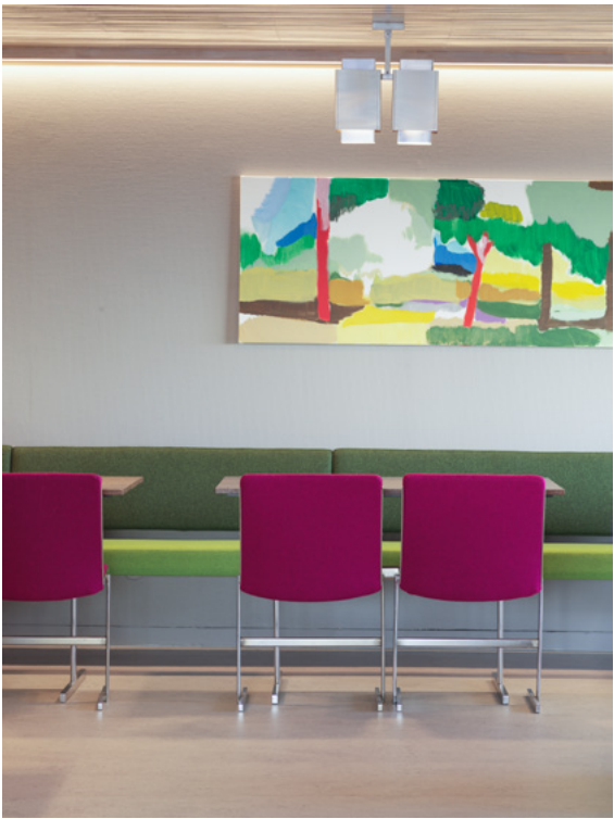
Lamper, stoler og bord er spesialdesignet av Bjørn A. Larsen, spesieltilpasset sofa med nytt tekstil.