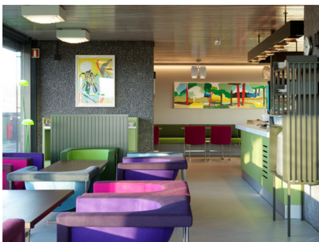
Spesialinnredning og møbler tar opp byggets detaljer og farger. Bildene på veggene er av kunstneren Morten Slette-meås fra Asker.