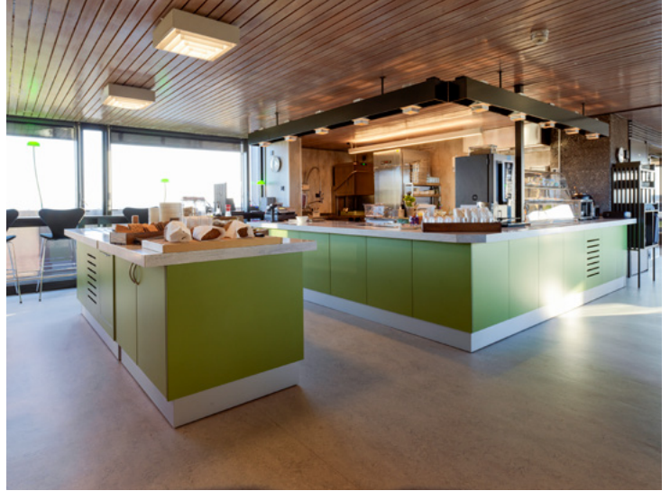
Kjøkkenfronter og overflater harmoniserer med øvrige detaljer.