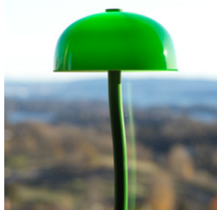
Fantastisk utsikt med lamper som ble designet til Nationalmuseum Stockholm av Front.