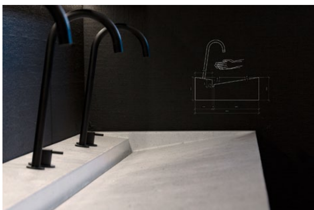
Servanten er utformet slik at alt vann raskt finner veien til sluket. Armaturene er skråstilt for å hindre sprut. Det er også rom nok mellom armaturene til å legge fra seg skihansker.