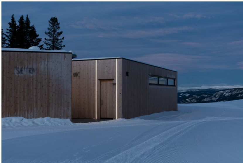
Bygningskroppen kikker ut over dalen.