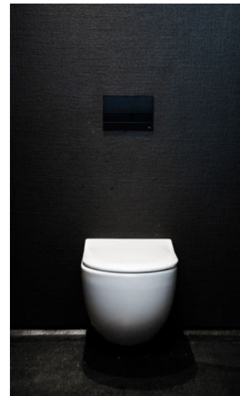
Inne i toalettbasene er detaljeringen spartansk. Strien gir dybde og tekstur til veggene.