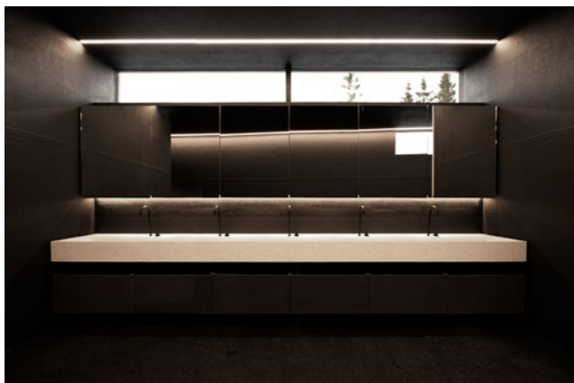
Den 850 kg tunge servanten i lys marmorbetong spenner fra vegg til vegg.