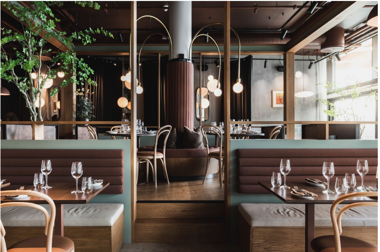
En overordnet farge- og materialpalett av natur, rødbrune og grønne farger definerer de store flatene.