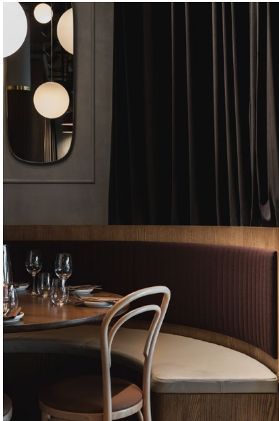
Ved endeveggen er det etablert runde sofabåser med gardiner som kan dele bordene for mer avgrensede spisearealer.