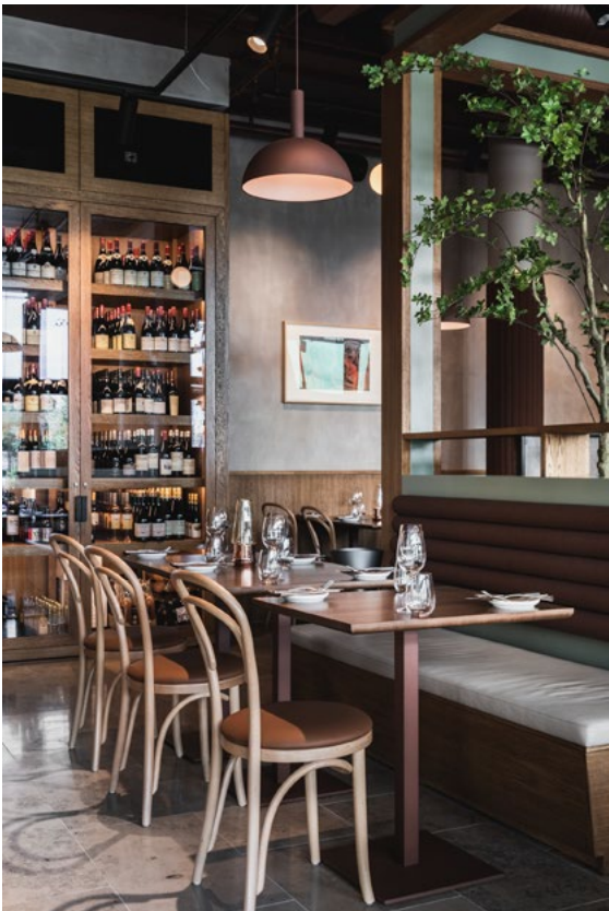
Klassisk kalkstein på gulvet, og brystningselementer på vegger i brunbeiset eik, rammer inn og samler de sterke fargene på møbler og fast innredning.