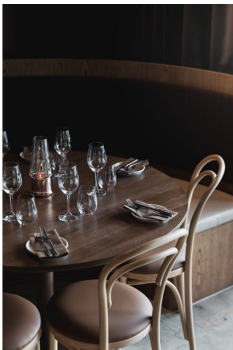
Et klassisk brasserie med samtidens uttrykk. Den ikoniske Wiener-stolen i ny drakt.