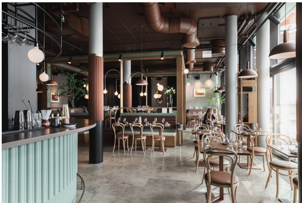
Store vinduer mot sydvest og uteservering. Myke elementer som skinn og velour i det store betongrommet.