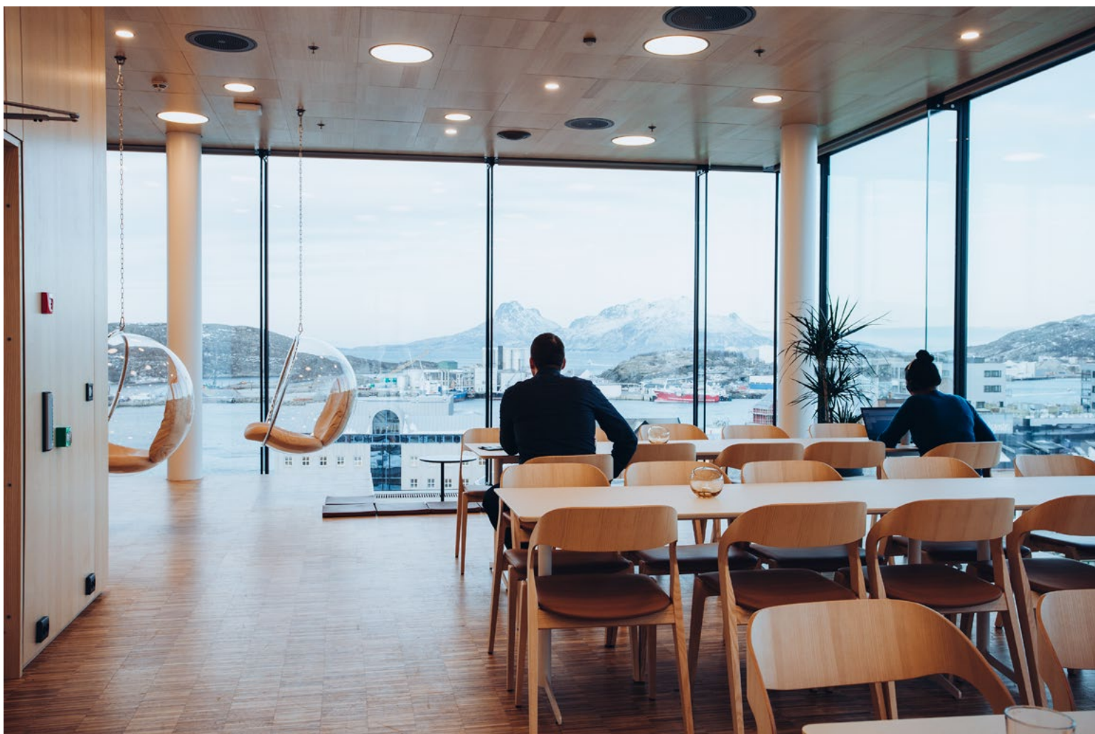
Kantinen i bygget er plassert i øverste etasje, og har en fantastisk utsikt over Bodø. De klare boblestolene som er plassert øverst i kantinen forsterker rommets luftighet og utsikt med sin transparente kvalitet.

kan man sitte ved bord som er vendt ut mot atriet, slik at man kan følge livet i folkeforumet fra avstand samtidig som man arbeider.