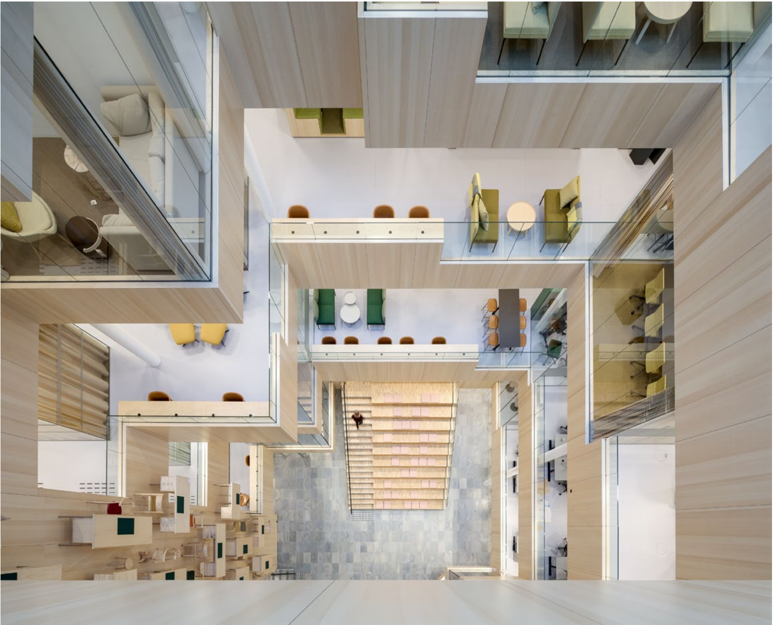
Fra de fleste arbeidssoner og fra gangbroer som krysser etasjene får man utsikt til atriet med sin spennende utforming. Noen av de mange multirommene og møterommene i kontoretasjene stikker seg ut i atriet, og man kommer tett på det som skjer utenfor sin egen arbeidssone.