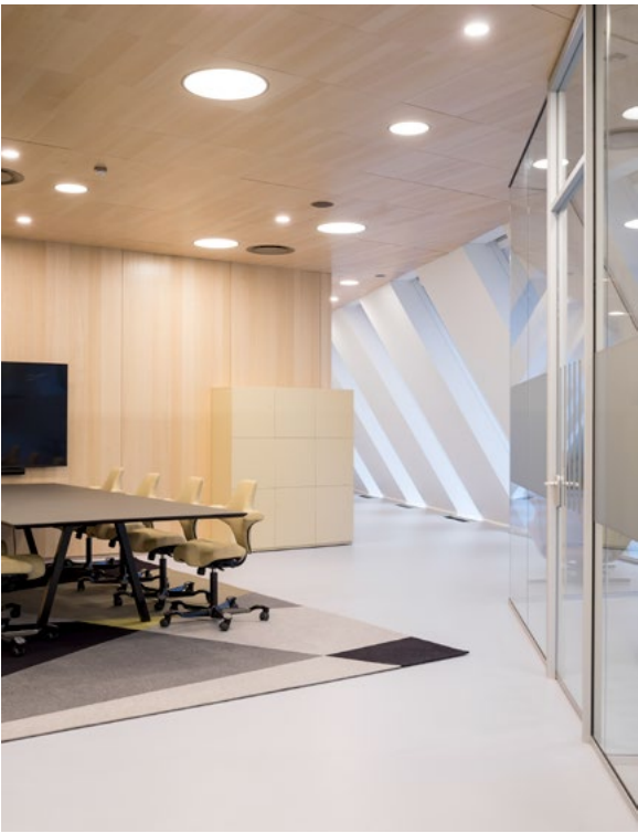
De aktive sonene er plassert i aktive områder i nærheten av hovedfartsårer og arbeidskafeer. De tilrettelegger blant annet for prosjektarbeid og møter i det åpne.