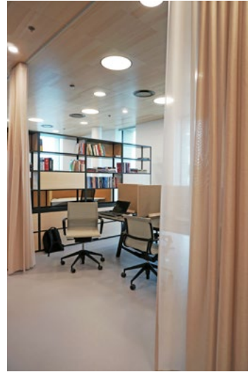
De rolige sonene har skjermede og varierte arbeidsplasser, adskilt av bokhyller og gardiner. De er plassert på steder i etasjene som har lite trafikk og har avstand til aktive områder. Her ser man en del av sonen som er møblert med langbord med har enkel strømtilkobling og mobile bordskjermer. Andre deler av sonen er møblert som en fullverdig arbeidsplass med høye bordskjermer.