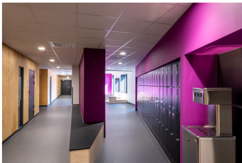
Undervisningsfløy for 9. trinn i 2. etasje har blomsterfarger. I hver etasje er det nisjer med vanndispensere, ledsaget av ordtak om vann på den vannfaste veggen bak.

utstyr til treningsrom og øvrige rom i flerbrukshall. Dette i samarbeid med oppdragsgiver, kommunens og skolens representanter.