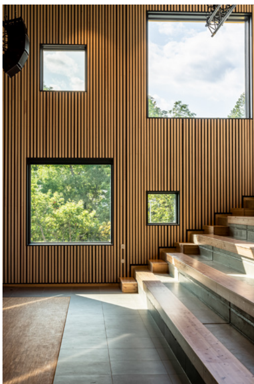
Fellesauditoriet/kulturarenaen med 200 sitteplasser i amfi, har fått navnet Varden, som ligger ca. 100 meter unna i luftlinje. Store vinduer mot vest gir utsyn mot landskapsvernområdet. Blendinggardiner sørger for full mørklegging ved behov. De øvrige auditoriene i undervisningsfløyene har fått navn etter Jeløys tre åser: Rødsåsen, Rambergåsen og Bjørnåsen.