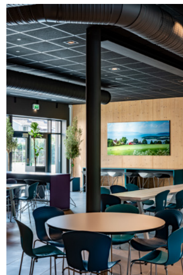
Kantinen har en miks av høye vangebord, småbord og ekstra lange, glassfiberarmerte piknik-benkebord. Langbordene kan brukes utendørs ved spesielle arrangementer.