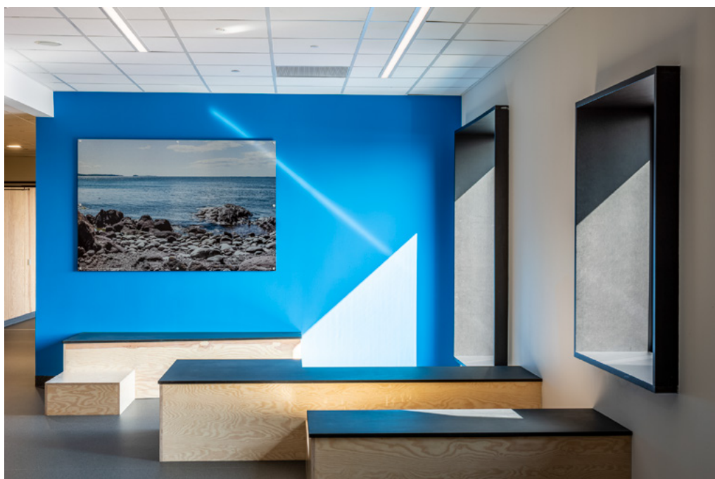
Undervisningsfløy for 10. trinn i 3. (øverste) etasje har farger fra himmel og hav. Temafargene i hver etasje underbygges av naturfoto fra Jeløy, tatt av fotograf Helge Eek. Veggbildet viser motiv fra Stalsberget, som ligger helt sør i landskapsvernområdet.