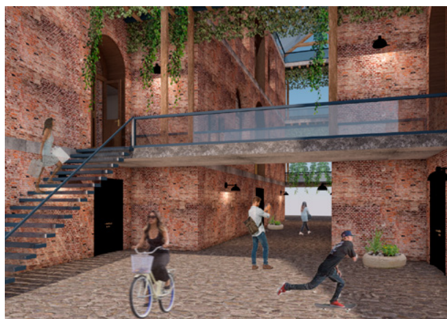
Fernsjo og Fløysvik, bærekraftig design.