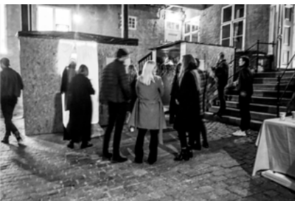
OAT + NIL-utstilling Rådhusgata. 7. Høyskolen Kristianas studentutstilling i forgården.