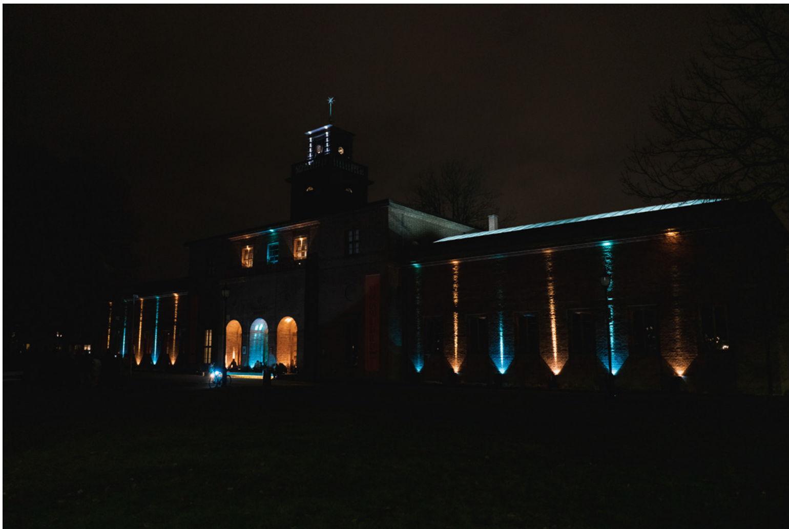
En av lysinstallasjonene som ble presentert på Vigelandmuseet.