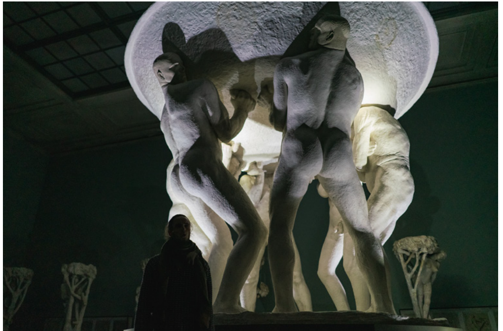
En av lysinstallasjonene som ble presentert på Vigelandmuseet.

I studiet får studentene innføring i bygningsvern gjennom kjente definisjoner, begreper og lovverk for å kunne argumentere for objektivt og subjektivt begrunnede løsninger innenfor lover og anbefalinger. Vi bruker begrepet «wicked problems» for å formidle de ofte motstridende mål i en designprosess. Et «wicked problem» er et problem som egentlig ikke kan løses. Et eksempel på dette er kravene til universell utforming i et eldre bygg som ofte står i motsetning til restriksjoner i forhold til vern av arkitektoniske elementer. (Ref. Biermannsgården, 5. semester).