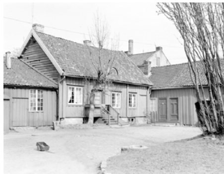
I prosjektet «Rehabilitering og redesign», inngikk vi et samarbeid med stiftelsesstyret i Biermannsgården, Maridalsveien 78.