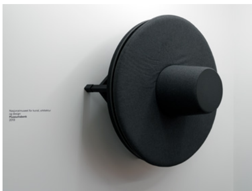
Spesialdesignet betraktermøbel for utstillingen Munch 150 på Nasjonalmuseet.