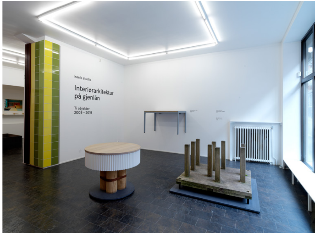
Skolepulten til KHIO, Treningsapparat Aktiv Mot Krefitt og salgsmøbel for Kon-Tiki Museet.