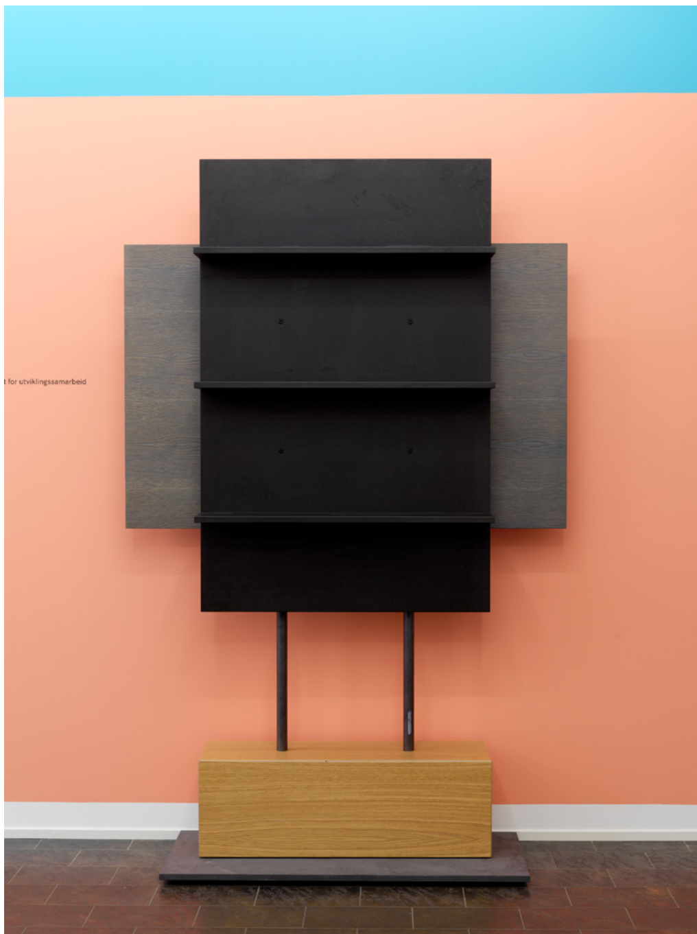
Display-møbel for kunstsamling Norad.