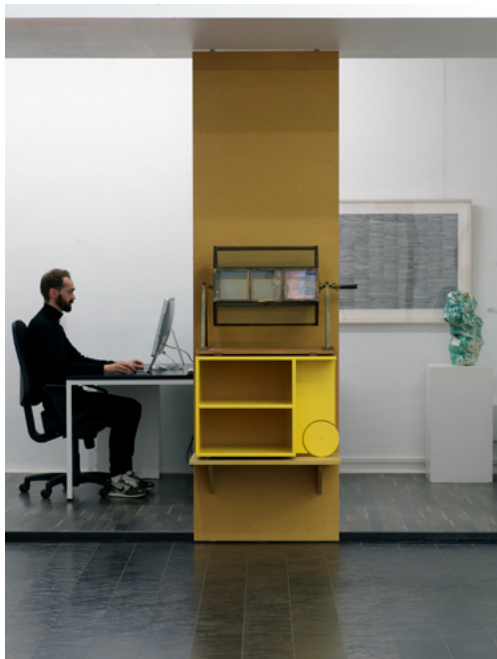
Historisk Tombola for kunstninsamling for Bildende Kunstneres Hjelpfond.