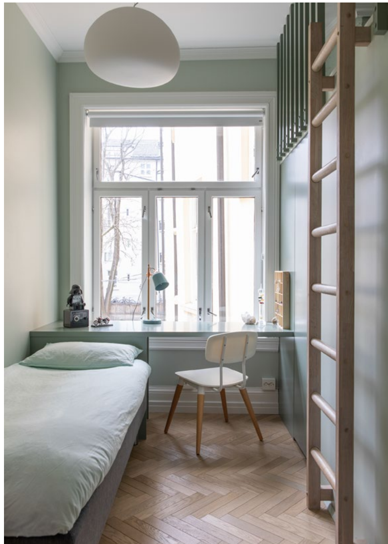
Barnerommet hvor takhøyden utnyttes til en hems for lek og overnatting.