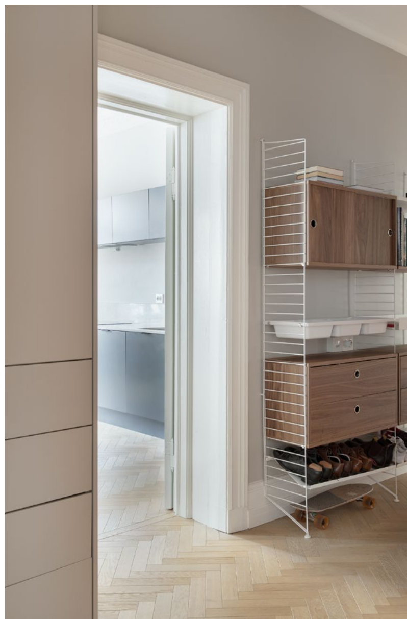
Den smale korridoren er utnyttet maksimalt med en kombinasjon av spesialtegnede skap og standard hyller.