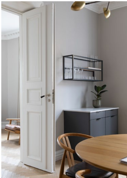
Gjennomgående fiskebensparkett fører rommene sammen.