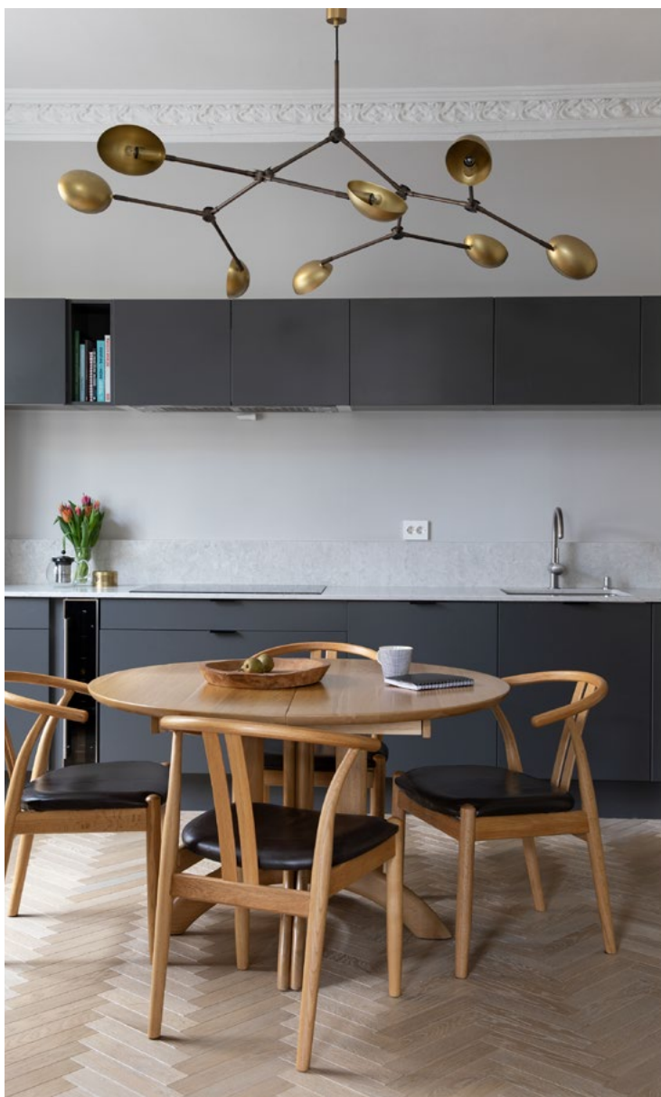
Nytt kjøkken ligger i en av de gamle stue- Gjennomgående fiskebensparkett fører rommene sammen.