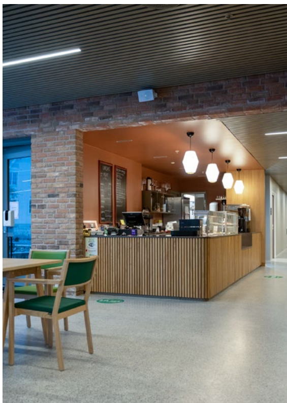
Kafeen er åpen både for beboere, naboer og gjester.