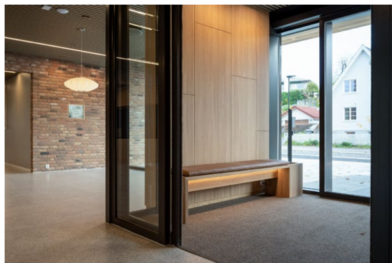
Sittebenken i vindfanget er god å ha.

Det første man møter inne i bygget, etter å ha passert vindfanget med egen sittebenk, er en sentralt plassert gasspeis. Peisflamme kan ses fra hele det store fellesarealet og bidrar til lunhet og hygge. Videre har man en åpen og lav resepsjonsdisk til høyre og en tilsvarende lav kafedisk på venstre side. Et felles designuttrykk med eikespiler, varme bakgrunnsfarger og et vakkert terrazzogulv binder funksjonene sammen. Lave disker gir uttrykk for imøtekommenhet og likeverd. Alle fellesfunksjoner og aktivitetsrom ligger på plan 1 som forbindes av hindringsfrie og åpne gangsoner. Gårdsrommene og de grønne takterrassene er lett tilgjengelige, og de store glasspartiene i fellesarealene gir beboerne mulighet for kontakt med