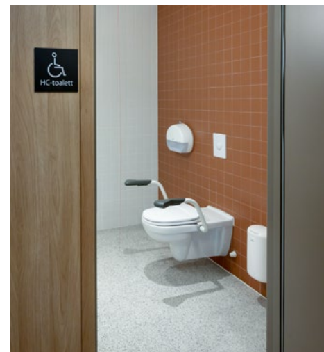
Kontrasterende farger tilfredsstiller krav om universell utforming, men er også identitetsskapende og positive designgrep.