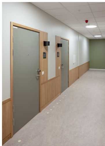
Korridorene til leilighetene er praktiske, men også designet med tanke på hjemlighet og vennlighet.