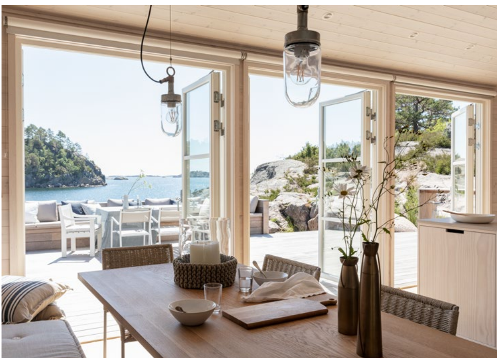
Terrassedører i begge retninger visker ut skillet mellom ute og inne, selv når det er ruskevær og inneliv.