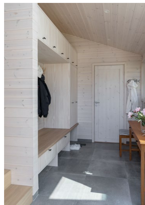
Plass til oppbevaring av sportsutstyr, svømmevester og lignende er løst ved å lage en liten bod innerst i entreen.

mot baksiden, slik at det i dag er to godt fungerende uteplasser. Der den ene vender ut mot skjærgården i sydvestlig retning, byr den andre siden på le og utsikt mot utmark. Terrassedører i begge retninger visker ut skillet mellom ute og inne, selv når det er ruskevær og inneliv. Kjøkkenet vender ut mot den store terrassen på sjøsiden. En ny spiseplass er plassert ytterst på terrassen og inkluderer en spesialdesignet benk utført i det hardføre og varige treverket IPE. En kant omkranser benken og sørger for komfortabel ryggstøtte for de som sitter der, samtidig som den rammer inn spiseområdet og sørger for noe beskyttelse mot vær og