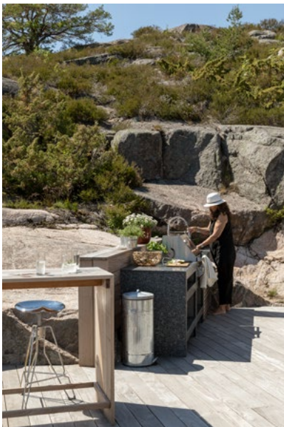
Hytta har fått et nytt og robust utekjøkken i granitt.