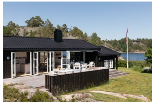
Familiehytte fra 1963.