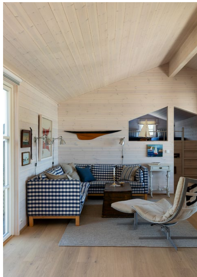
Familieklenodier som eierens 30 år gamle Hødnebo-sofa fikk en oppgradering.