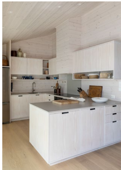
Nytt og større kjøkken.