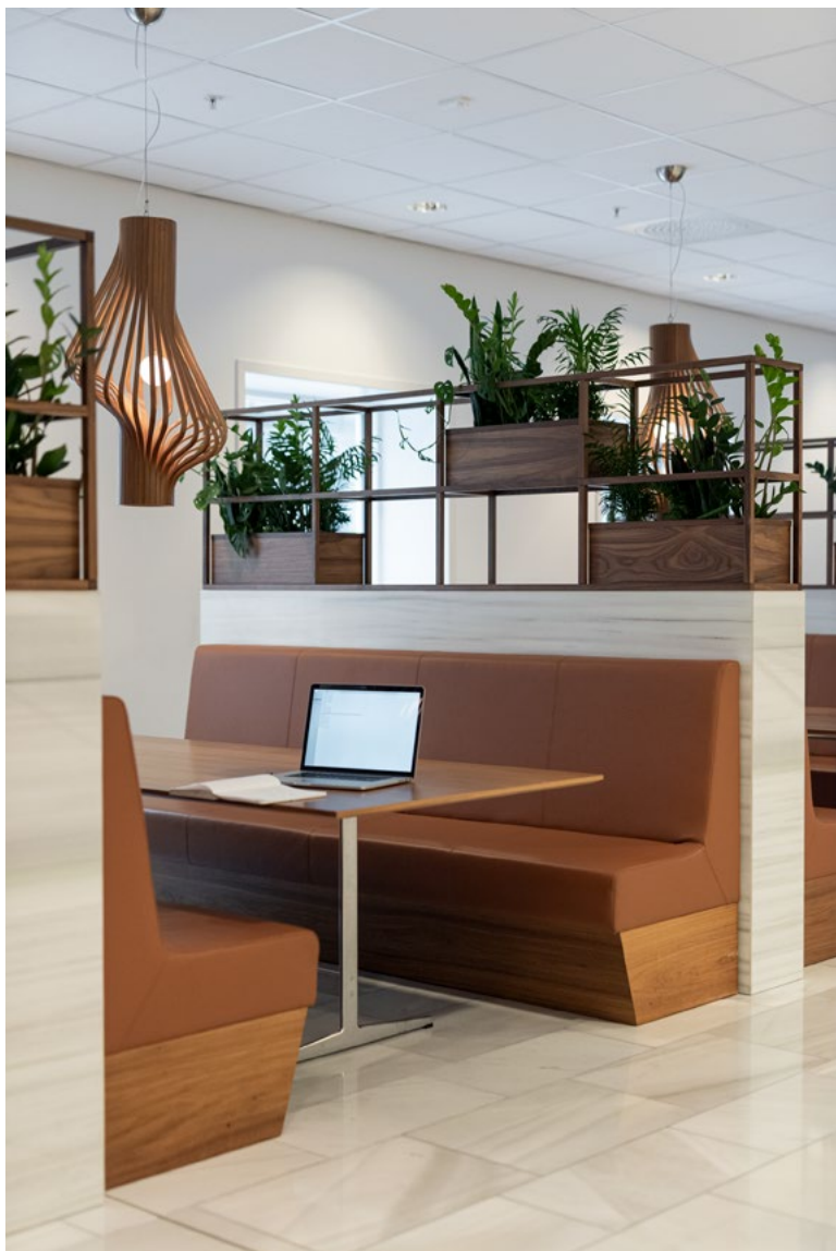
De oppgraderte sonene i kantinen del i Østbygget. Også her er plantekasser en del av skjermingen mellom båsene.