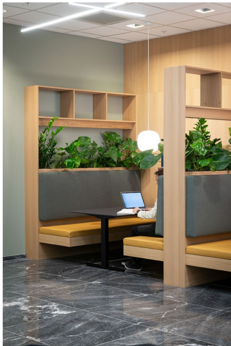
Flerbrukszoner i kantinen del i Vestbygget er utformet i eik. Båsene skaper gode plasser for bespisning og arbeid, og plantekasser skaper en behagelig skjerming.

servicetorg og møtesenter. Med et økt antall personer som sogner til hovedkontoret, og som en del av en oppgradering av personalrestaurantene har det vært en målsetting å legge til rette for mer arbeid- og møtevirksomhet i arealene, uten at det skulle gå på bekostning av antall spiseplasser.