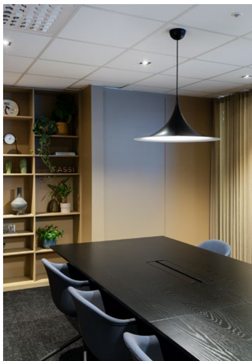
I en nisje på møterommet ble det plass til kaffestasjon og en plassbygget hylle til dekor og utmerkelse som bedriften har fått.