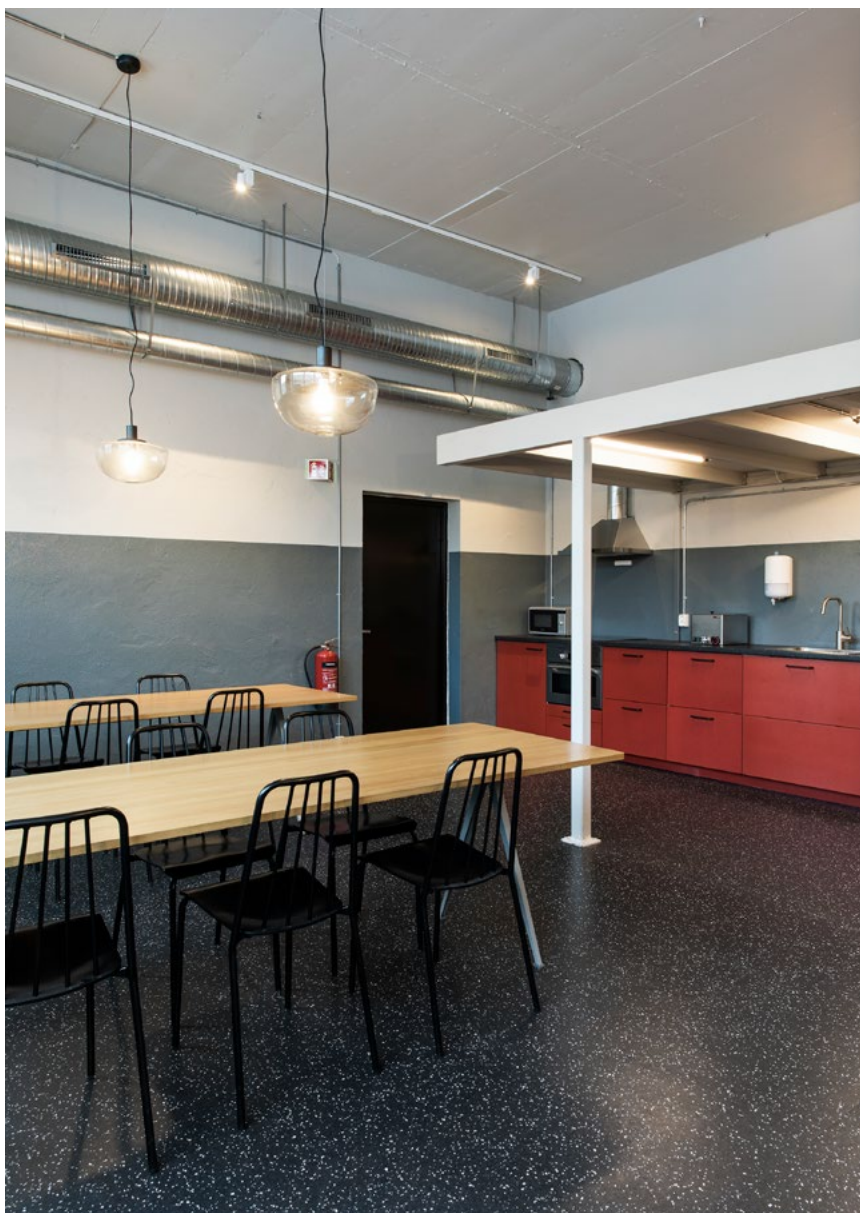
Åpent elektrisk anlegg og synlig ventilasjonsanlegg spiller på lag med den industrielle stilen, i stedet for å forringe den. Stolene er den norske klassikeren Grorudstolen fra 1958, designet av Hans Brattrud, og relansert av norske Objekt. Den gamle messaninen ble beholdt som overbygg over kjøkkeninnredningen. Innredningen består av mattlakkert valchromat, som er en fuktbestandig gjennomfarget mdf, godkjent for kontakt med matvarer.