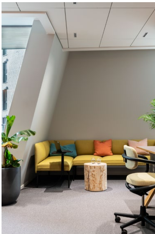
De sentrale sonene har variert møblering som understøtter funksjonen til sonen. Alle sonene har ulike mengder av arbeidsplasser med docking for de som trenger dette. Aktive soner er også utstyrt med store skjermer, glasstavler og annet verktøy som gjør at man enkelt kan fasilitere eksempelvis større uformelle møter og prosjektoppstartøkter.