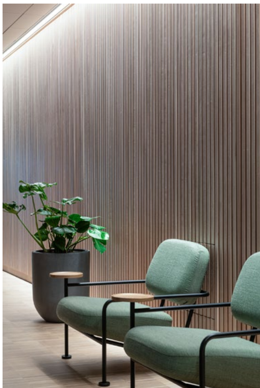
Alle kjerner i etasjene er kledd med eikespiser og lyddempende plater for et optimalt lyd miljø. Naturmaterialer er i fokus i Rambølls brand guide, og bruk av eik både på vegger og gulv gir lokalene et varmt uttrykk.