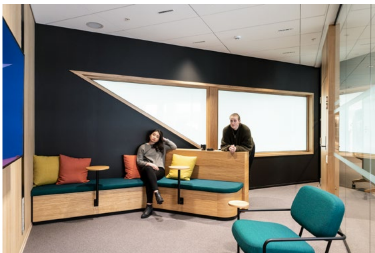
Flere av møterommene har møblering som understøtter utradisjonelle møter. På bildet ser man det som kalles iderom. Her er det mye gulvplass og glasstavler på hjul for å kunne gjennomføre et mer aktivt møte.