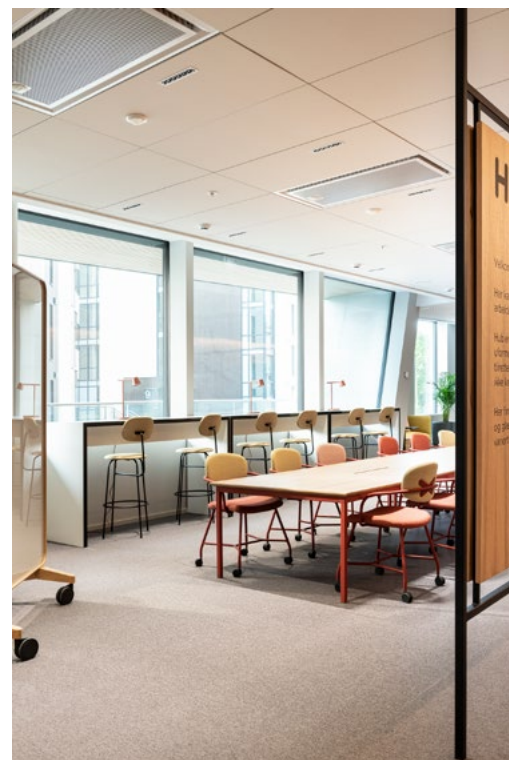
Skilting i de sentrale sonene; prosjekt-, dropdown- og stillesoner, forklarer mulig bruk og kjøregler. Skiltene fungerer også som skjerming mot gangsonen, og har glasstavler på innsiden.

del innenfor det samme leiearealet, ved å gradvis øke andelen delte plasser.