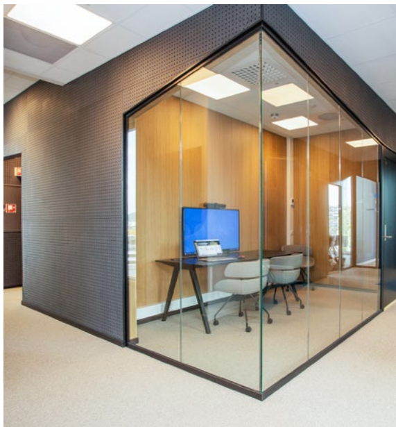
Lite videomøterom i den sorte kjernen som ligger i begge etasjer. Her fra plan 07 der det er møteromssenter.