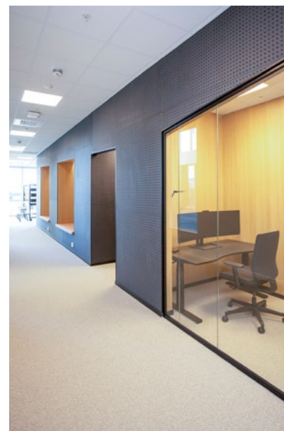
En sort kjerne kledd i perforert valchromat med varm eik som kontrast. Her ser man også inngang til kopirom, samt skrånet glassfelt over multirom som også har varm eik på innsiden i likhet med nisjene.