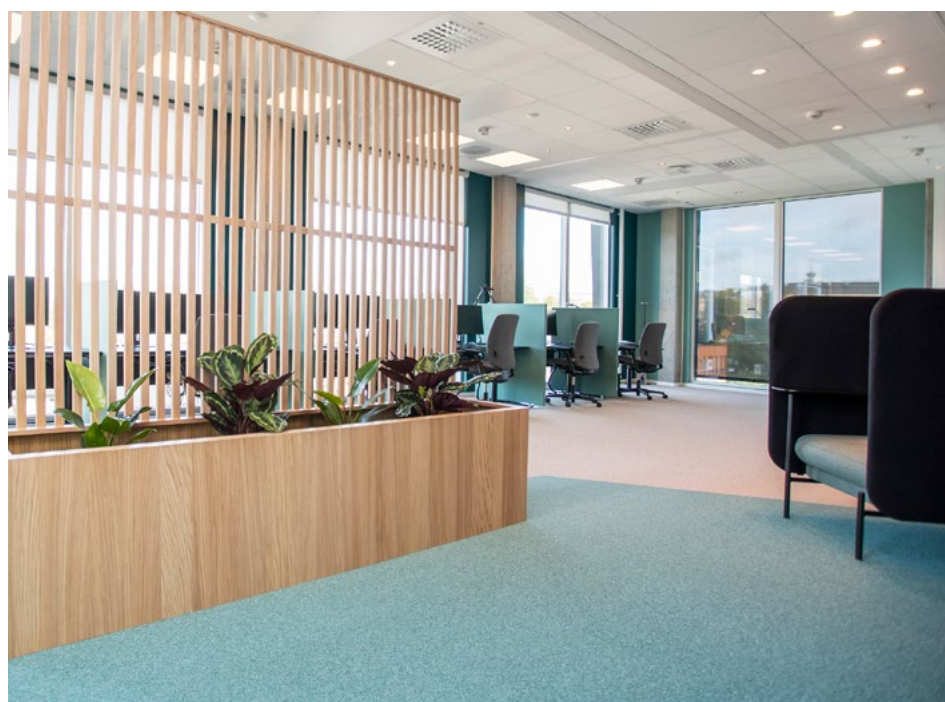
Stillesal på plan 07. Her setter man seg når man absolutt ikke vil bli forstyrret. For å få et reelt stillerom er det viktig med gode bruksregler. Hvis man skal få tak i en person som sitter her inne, må man sende dem en e-post eller melding. En plantekasse med spiller bidrar til en opplevelse av skjerming mot inngangsdør.

man i begge etasjer ordinære landskap med free seating. Med kjerner og multirom som buffer for arbeidsplassene, kommer man over i en felles samhandlingssone for teamarbeid og ad-hoc-arbeid der man også har felles oppbevaring. Denne sonen glir over i den sosiale sonen med kjøkken og internt trapp. På plan 06 finner man Sykehusbyggs inngang. Dette er også etasjen med høy puls. Det vil si at det er lagt til funksjoner og soner med høy grad av sambruk og samhandling, ofte i åpne og semi-åpne løsninger for å få glidende overganger mellom løsninger og funksjoner. Plan 07 er etasjen med lav puls. Det vil si at den sosiale sonen her er mindre, og samhandlingssonen er bak lukkede glassvegger. Man ser, men man hører ikke. Det har vært stort fokus på universell utforming, da de har ansatte som sitter