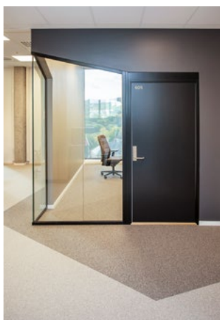
Geometriske felt i gulvet ved multirom, som kommer ut av rommet og ut i korridor. Dette indikerer at rommet er felles for alle og gir en logisk way-finding til felles funksjoner. Vinkelen på glassveggene bryter med det ellers kvadratiske rommet.