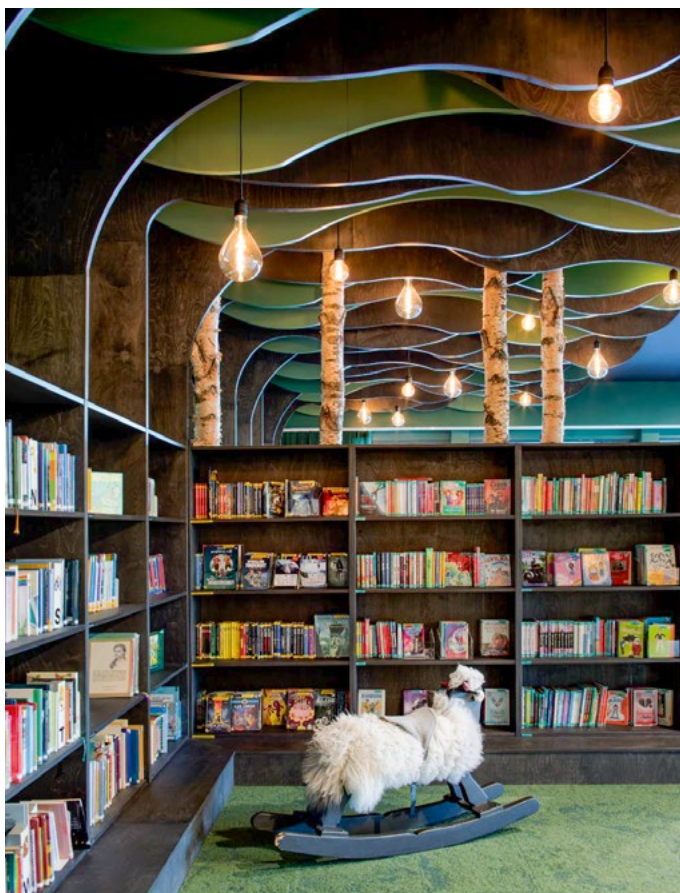
Barneavdelingen skal være et eventyrland. Elementer laget av beiset kryssfiner skal minne om skogen. Barna har fått et sted å gjemme seg. Et eventyrland venter.