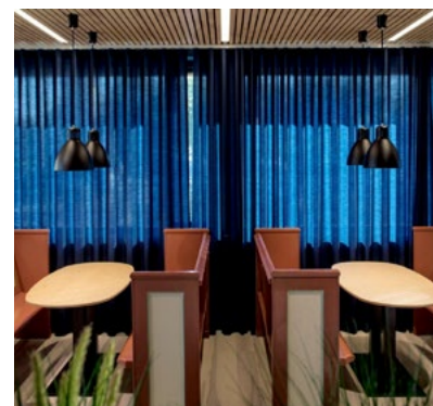
Ombruk av kirkebenker fra Bremnes kirke. Nå kan bømlinger sitte på kirkebenkene og se mot kirken de opprinnelig kom fra.