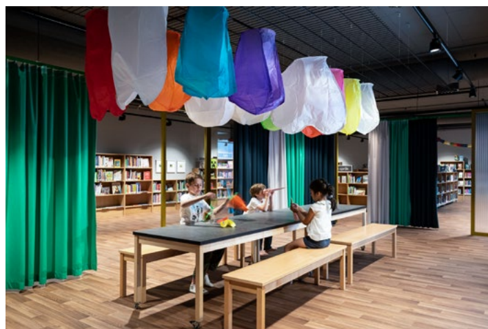
Makerspace er plassert sentralt i rommet og er innredet med verkstedbord og utstillingsgrid i taket.