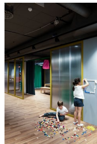
Legovegg på utsiden av Makerspace.

i kanalplast, oppslagstavler, legovegg og et stort grønt gardin som svinger inn og ut av elementet og gir mulighet til å lage avskjerming etter behov. Makerspacen inkluderer et arbeidsrom innredet med verkstedbenker og skap hvor barn kan bruke 3D-printer og diverse utstyr. Her kan barna ha verksted og stille ut det de lager på utstillingsgridet som henger fra tak og vegger rundt omkring i lokalet. Dette gir eierskap til stedet og ikke minst stolthet for barna og ansatte.