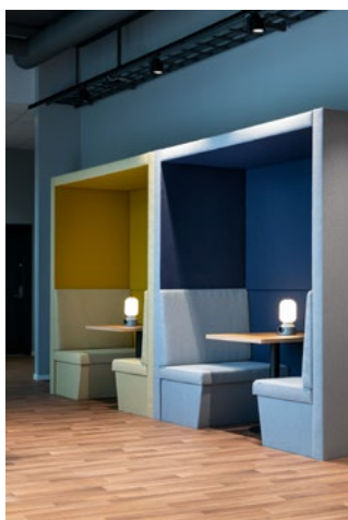
Alkoverne blir brukt som møterom av ansatte, av publikum og av bydel Nordstrand.