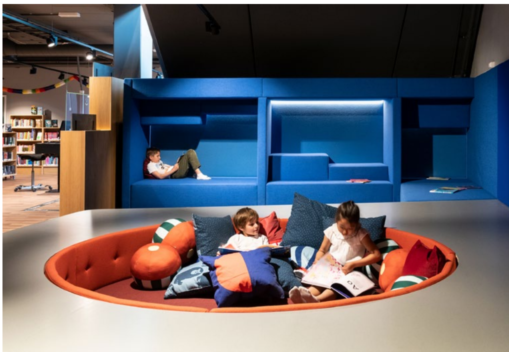
Plassbygde møbler i forskjellige former og høyder under amfitrappen. Sterke, klare farger gjør rommet dynamisk. De blå alkoverne skaper fine gjemmesteder for lesing eller avslapping. En stor nedfelt sirkelformet sofa inviterer til samling. Her kan flere være sammen uten å forstyrre hverandre.