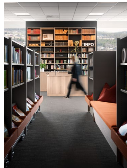
I biblioteket er det tegnet en del spesialinnredning som gir en egen identitet til lokalet og i tillegg gir skreddersydde funksjoner. Integret mellom bokhyllene er det noen steder spesialtegnede polstrede sofabanker. Hyllene i barneavdelingen har bokser hvor bøkene kan stå med fronten frem så det blir lettere for ivrige barnehender å bla og finne frem i bøkene.