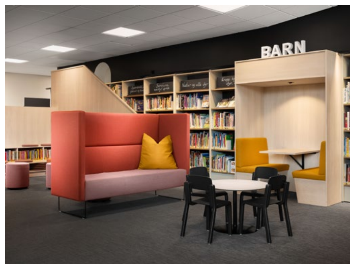
Her i barneavdelingen er det tegnet sittebasen hvor barn og voksne kan sitte sammen. Møbleringen er løs og fleksibel og kan ryddes unna for aktiviteter på gulvet.

og en del er fastmontert for å hindre at de flyter ut i gangsonen.