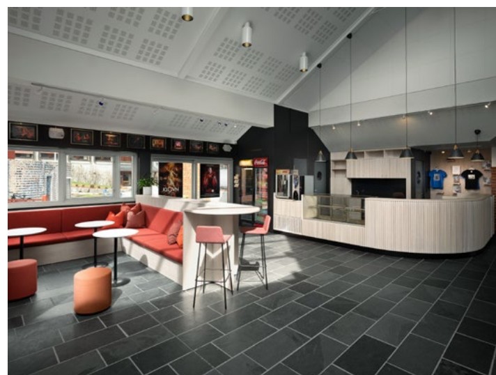
Skranken i øvre foaje tar imot alle besøkene og skifter funksjon i løpet av dagen og til ulike arrangementer. Det var derfor viktig å utforme den funksjonell for flere typer oppgaver. Mange faktorer spilte inn angående utformingen, og plasseringen var i tillegg låst for å få tilgang til kjøkkenet og beholde romslige gangsoner.