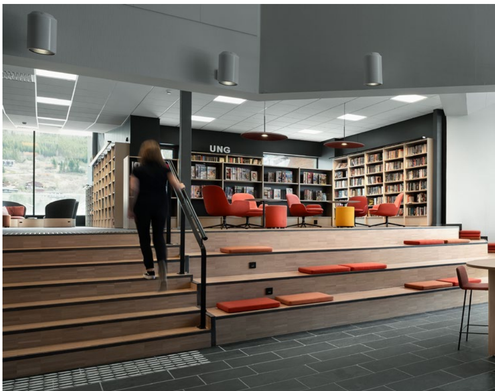
I den åpne overgangen mellom foaje og bibliotek er det en stor trapp som kan brukes som amfi og sitteplasser til daglig. Møbleringen i toppen av amfiet er løs og fleksibel, og kan ved arrangementer ryddes bort så amfiet kan benyttes som scene.