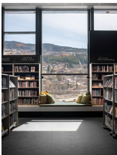
Langs de store glassvinduene i fronten av fasaden er det nederste hyllnivået trukket ut så de danner en langsgående hylle og sittebenk langs hele rommets bredde. I vinduspостene går benken helt ut til glasset. Dette skaper selvsagt attraktive sittekroker med en mektig svevende utsikt, men også en enkel møblering som gir plass for dagslyset. Bokhyllene på disse veggene er plasserte opp på benkene. Sokkelen er godt inntrukket for å gi god tilgjengelighet til hyllene og benken er svært lite til hinder for alle brukergrupper.