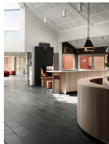
Romslige gangsoner med en møblering som skaper orden og flyt i øvre foaje. Det er valgt eik som gjennomgående treverk i spesialinnredningen, for et tradisjonelt og varig uttrykk. Spileledningen skjuler skapdører som kan åpnes og skyves inn mellom skapstammene når kiosk eller butikk er åpen.