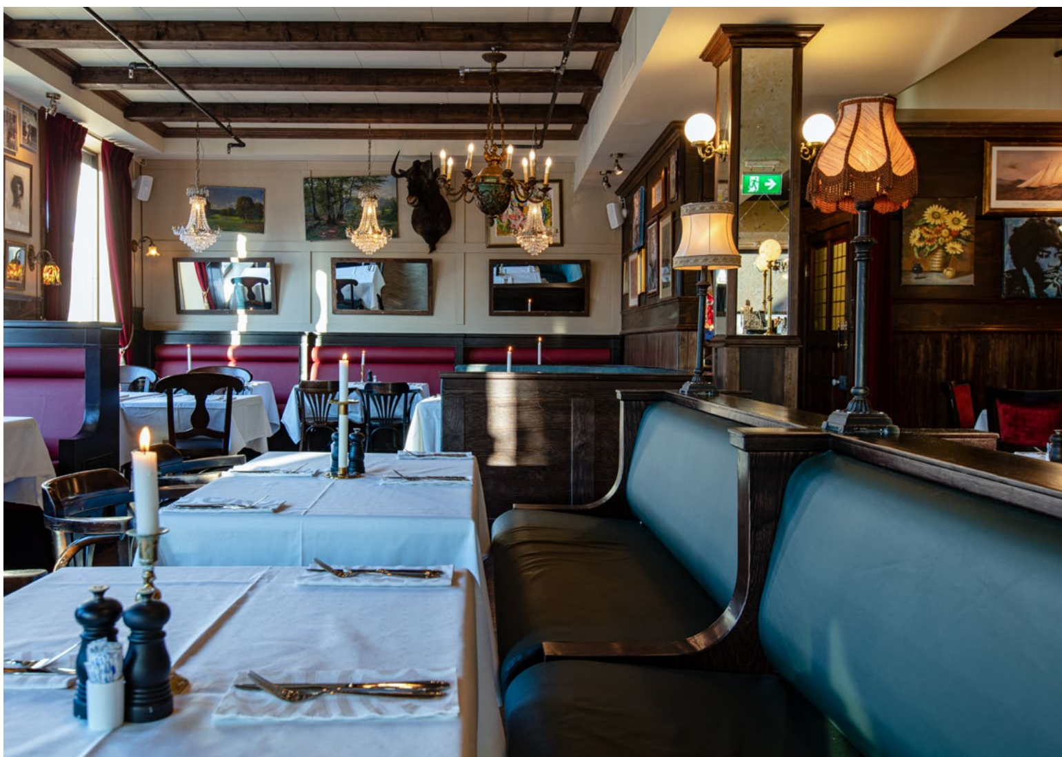
Huset er ført tilbake til tidligere storhetstid. Det gjelder også i detaljene; som lysekroner, hvite duker og levende lys.