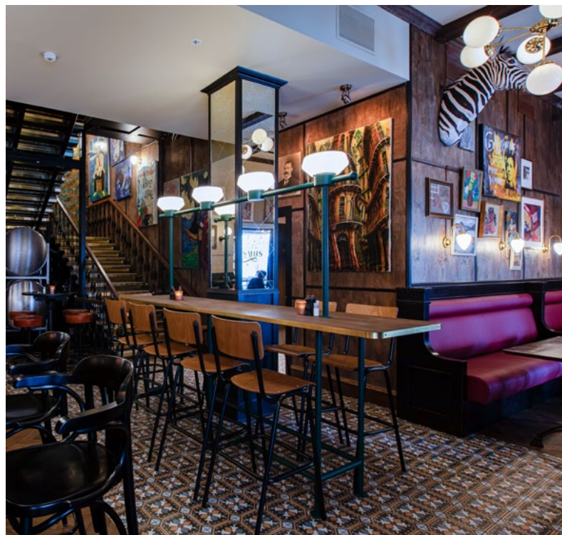
Arbeidstittellen var Lorry sør. Interiørarkitektene ville gjenskape litt av atmosfæren fra Lorry som Petter Abrahamsen skapte på 90-tallet i Oslo.