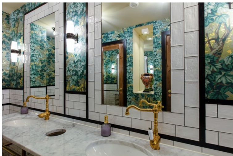
Attraktivt og kult innredet for den voksne del av befolkningen i Kristiansand.