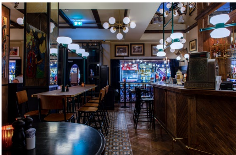
I første etasje ligger en bar og kafe som en del av inngangspartiet.