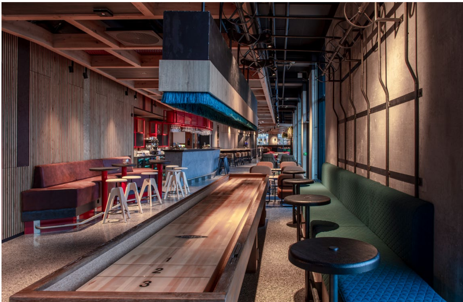
Sofa får elementer fra en skiheis. Vinskapet har tydelig referanser til den gamle gondolbanen, en lampe med utgangspunkt i skiheisenes T-kroker.