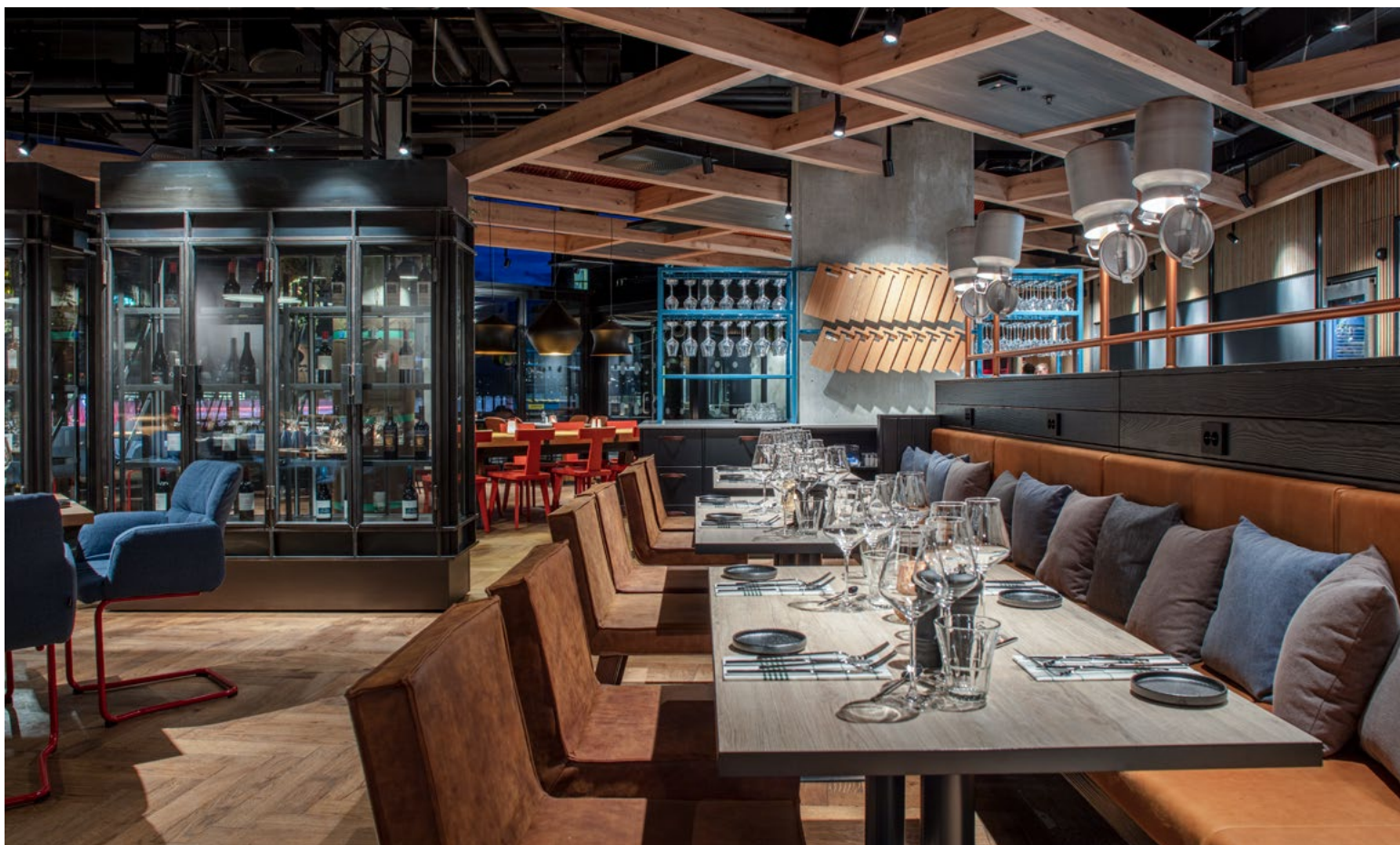
Området skulle kunne fungere både som frokost-, lunsj- og kveldsrestaurant.