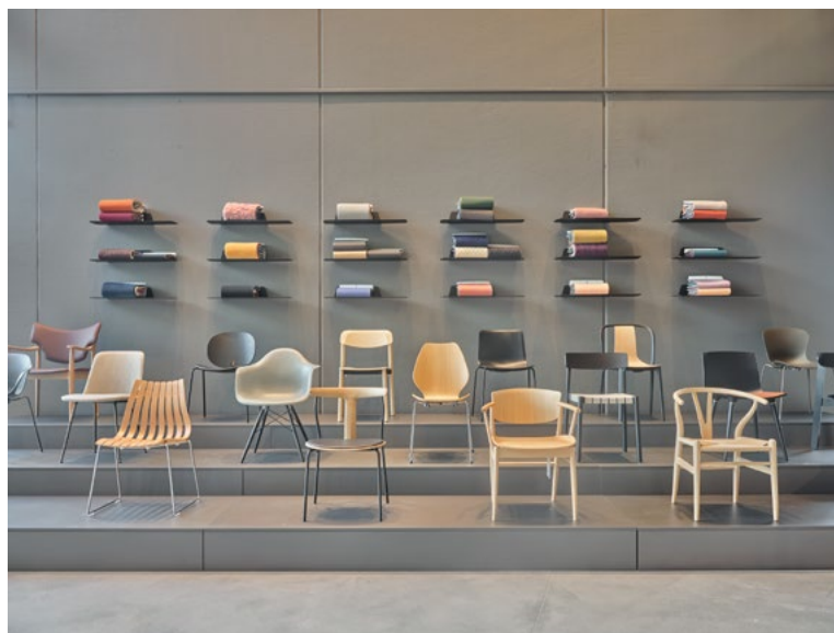
Rommet har en tribune som til vanlig fungerer som en stolutstilling, men som ved arrangementer tillater å samle mange besøkende for å presentere nyheter. Utstillingen oppleves delikat og rolig, og tillater at møblene får tre frem.