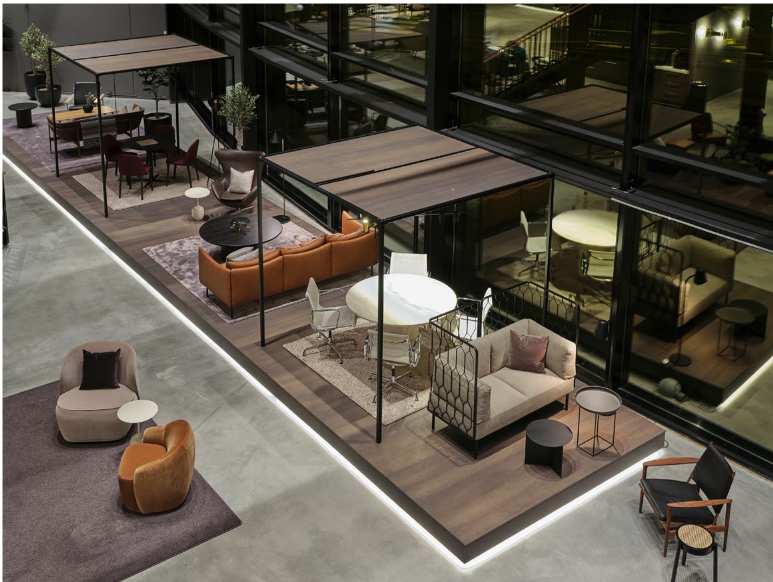
Interiørarkitekt har lagt stor vekt på gode møtesoner – siden fremtidens kontor blir mer og mer en møteplass. Det er store vinduer fra gulv til tak. Foran vinduene har de valgt å legge en scene med to utstillingskuber i stål.