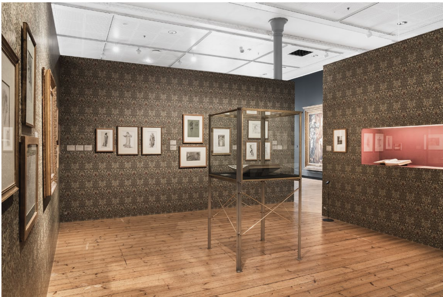
Rom i rommet, med tidsriktig tapet fra Morris & Co., gir en egen intim stemning. Nisje for utstilling av illustrerte bøker med en varm rød farge som skaper blikkfang.