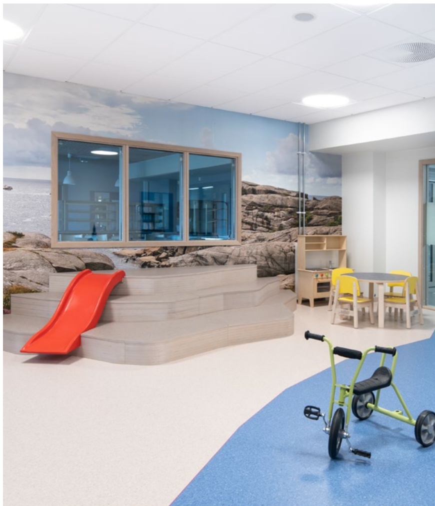
Lekerom med svaberg-amfi og fototapet fra Vestfolds skjærgård.