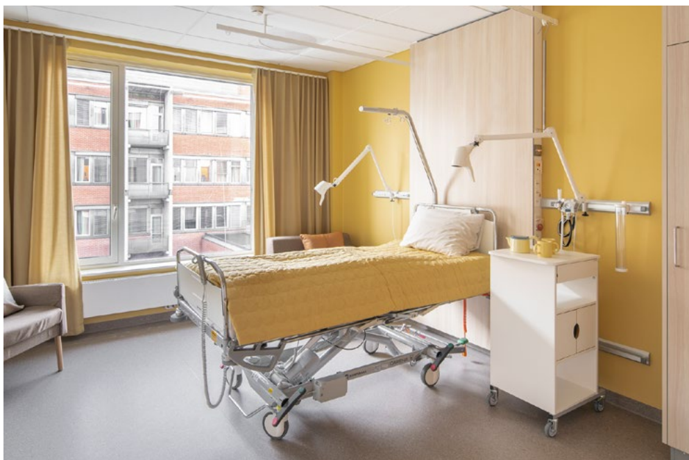
Sengerom, gult. Bed-head med overflate i eikelaminat skjuler tekniske føringer og bidrar til at sengerommet virker mindre institusjonsaktig.