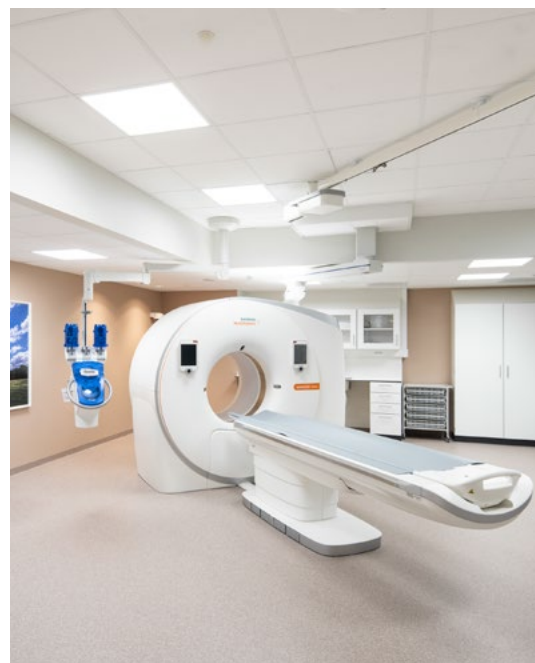
CT-rom med beroligende veggfarge.