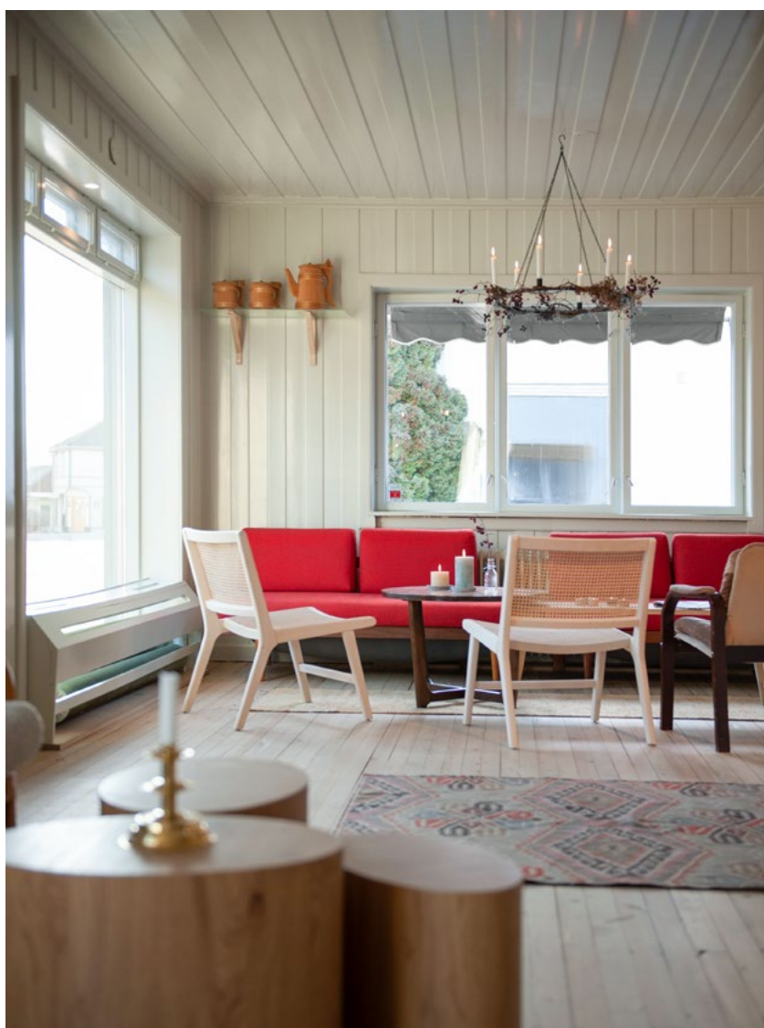
Lounge i forbindelse med resepsjonsarealet. Ombrukte møbler i kombinasjon med nye. Veggfarger tatt fra den gamle arkitekturen i nærområdet.