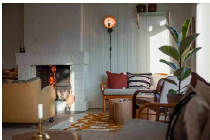
Original peis har fått nytt liv, i det som nå har blitt inngangsparti og lobby. En hjemlig følelse som innbyr til peiskos.