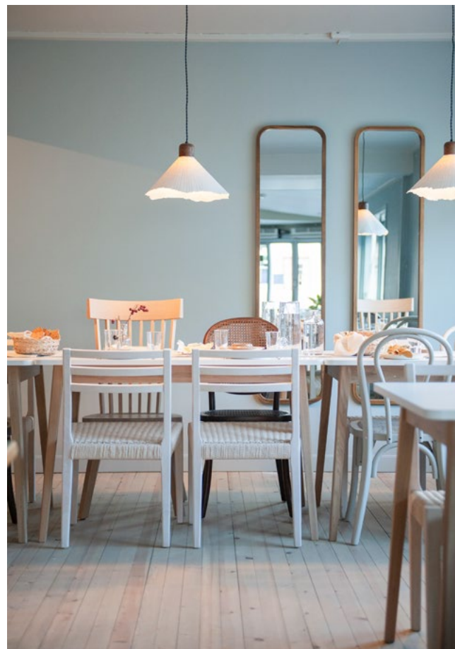
Matsalen med langbord for sosiale samtaler mellom hotellbesøkende. Kombinerte stoler for en avslappende atmosfære.