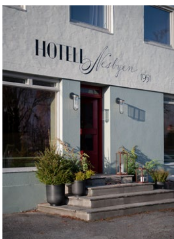
Fasade, med inngangsparti. Ny håndmalt logo, av Richie Chlasczak, fra Oslo Skiltmaler. Rød dør i tråd med lokal historie.