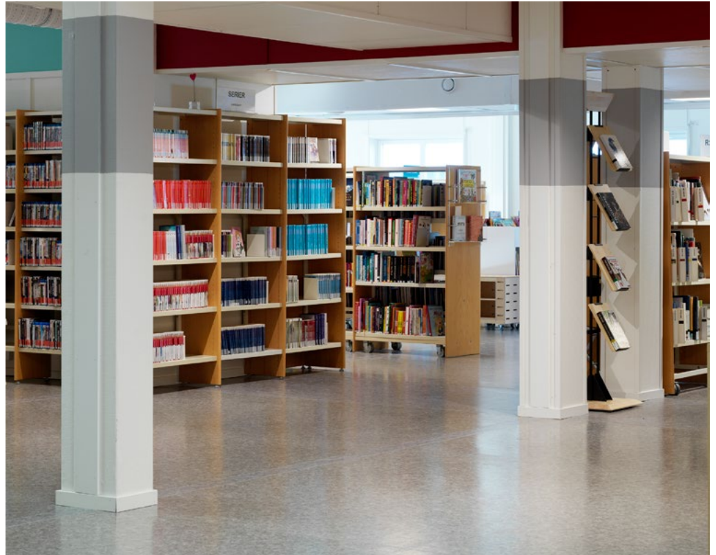
Bibliotekreoler ombruk fra tidligere bibliotek plassert i nytt mønster. Identitetsfarge brukt over for indikasjon om tilhørende tema. Kontrastfarge brukt rundt søyler med hensyn til universell utforming.