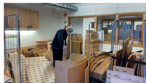
Befaring på ombrukslager til Asker kommune. Tidligere kontormøbler undersøkes for sitt potensiale for ombruk.