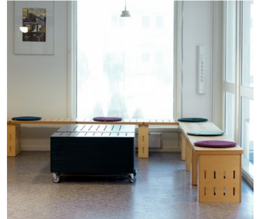
Ventesone med benker laget av akustikkplater og ombrukspuiter.