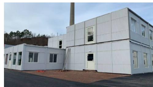
Byggeprosess hvor eldre brakker settes sammen for å skape arealet til det midlertidige innbyggertorget.