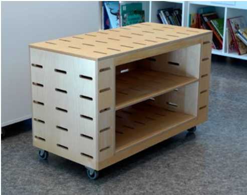
TV-benk på hjul laget av tidligere akustiske bordskillevegger.