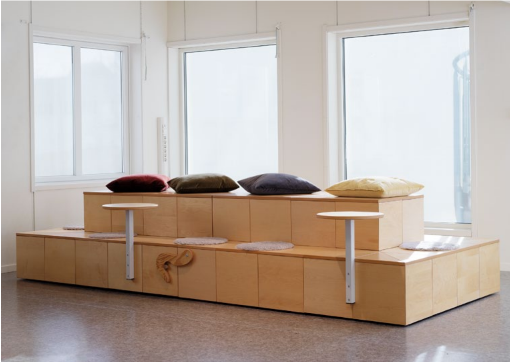
Todelt amfi på hjul laget av tidligere avlastningsbord. Brukes som roligssone og lesestunder