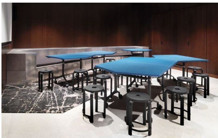
Museet tar imot skoleklasser, barnehager og andre publikumsgrupper til tematisk programvirksomhet som foredrag, omvisninger og kunstneriske aktiviteter forbundet med de ulike utstillingene. Virksomheten foregår i store formidlingsverksteder og velkomstrøm for publikumsgrupper som har booket en aktivitet eller omvisning.