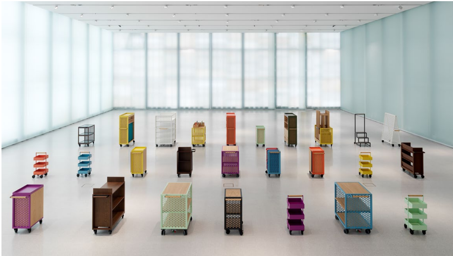
Tralleserien spesialdesignet til Nasjonalmuseet av Cadi+Kaels Studio. Trallene er plassert i Lyshallen, museets store utstillingsområde.