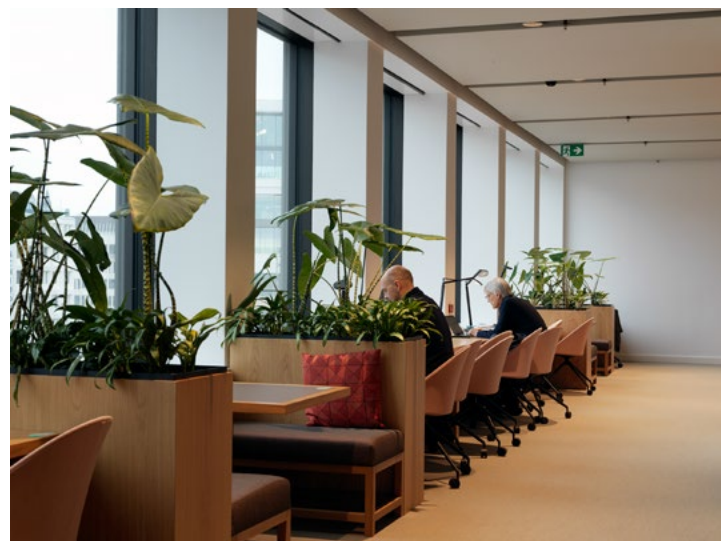
Arbeidssone i administrasjonsetasjen.

kvadratmeter stort museum med mange aktører involvert er det viktig å finne en felles, grunnleggende og samlende designvisjon for den praktiske og visuelle utformingen av interiøret. Målet har både vært å skape en estetikk i form av materialer og overflater som snakker med byggets arkitektoniske uttrykk og et sluttresultat som former og formidler et helhetlig preg. Interiørarkitektene har også tatt initiativ til å løfte design som et viktig virkemiddel for museet både gjennom samarbeid med møbeldesignere og egendesignede elementer. De har blant annet tegnet en serie traller med ca. 20 varianter og totalt ca. 120 traller for bruk til daglig arbeid i alle museet arealer. Trallene har et unikt særpreg som bygger opp under