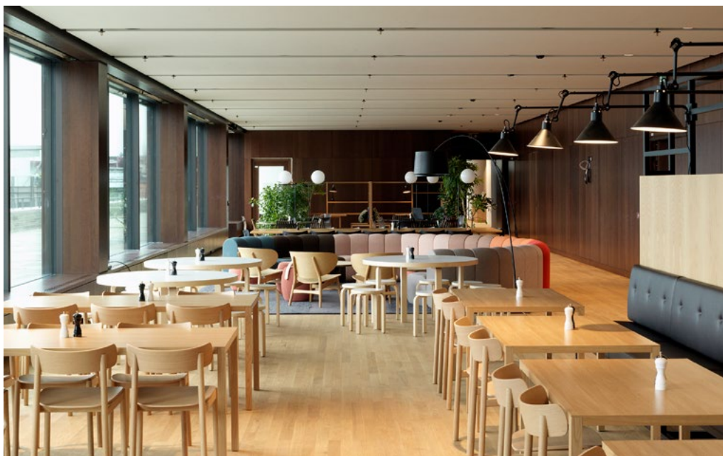
Nasjonalmuseet valgte et aktivitetsbasert arbeidsplasskonsept og kjøkkenet er den største sonen for samhandling. I tillegg fungerer den som kantine noen timer om dagen.