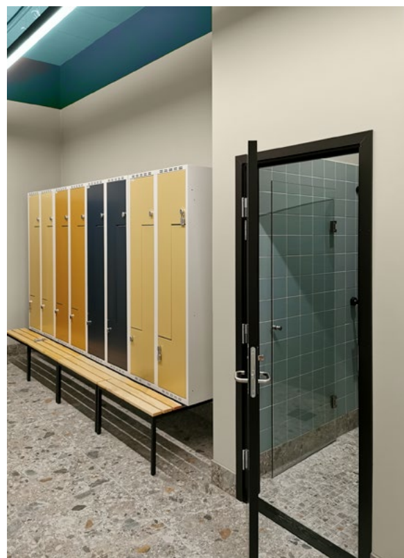
Garderober for de ansatte.