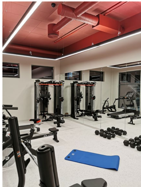
Trimrom for de ansatte. Rustrød himling gir energi til rommet.