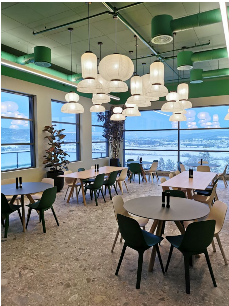
Kantineområdet. Store vindusflater reduserer behovet for belysning.

→ Kantinen. Enkelte hos Ramberg var skeptiske til fargevalgene. Men alle er fornøyde når det nå står ferdig.