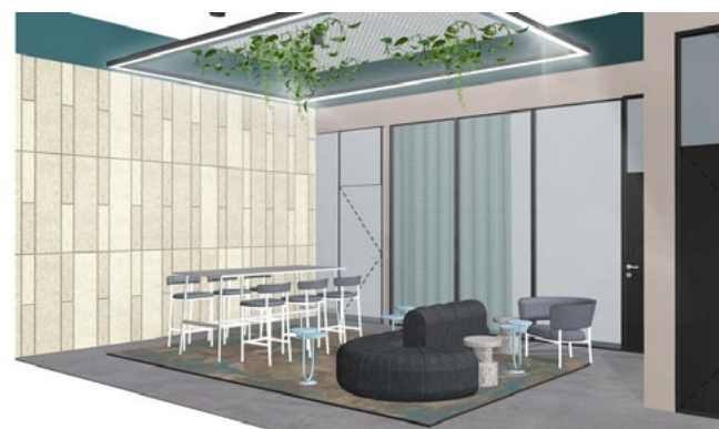
Skisse sosial sone.

viser deres identitet. Som en veletablert familiebedrift i 93 år var det viktig å vise at de ikke er sidruppa og gammeldagse, men derimot nytenkende og innovative. Og beskjeden var tydelig: «våre ansatte er vår viktigste ressurs».