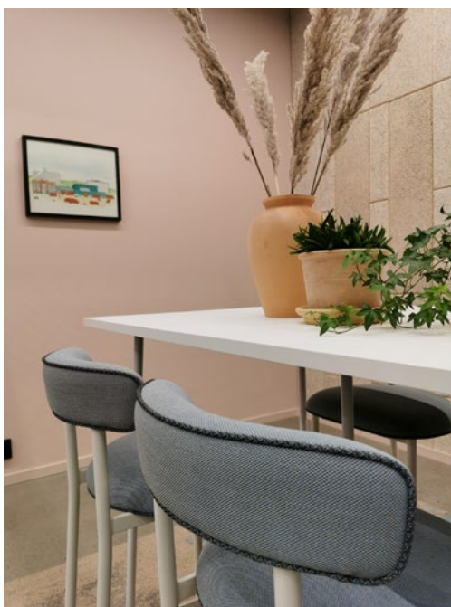
Veggene ble malt rosa hvor enkelte veggflater utsmykket med BAUX-akustikkplater i ulike fargetoner.