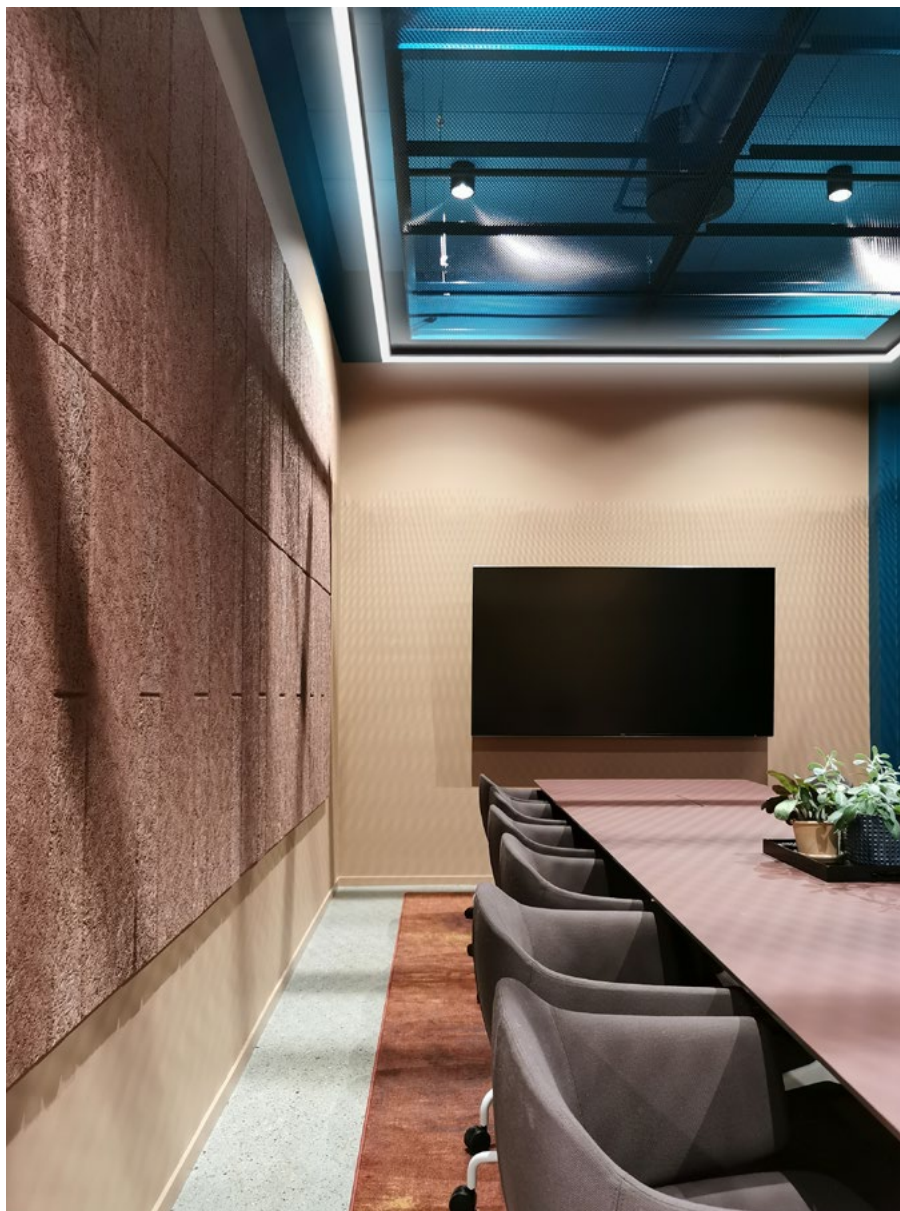
Det er brukt ulike grøntonner, blått, rustrød og burgunder i himlingene.