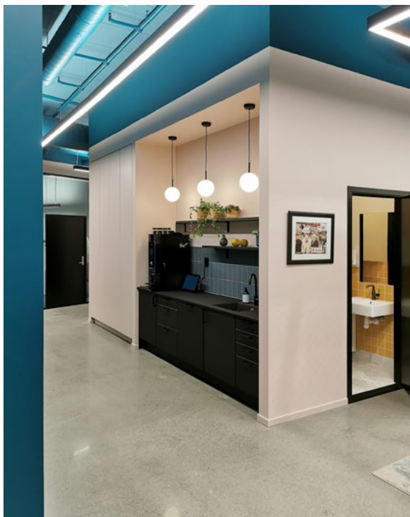
I gangareal og sosial sone ble råbetongen på gulv polert.