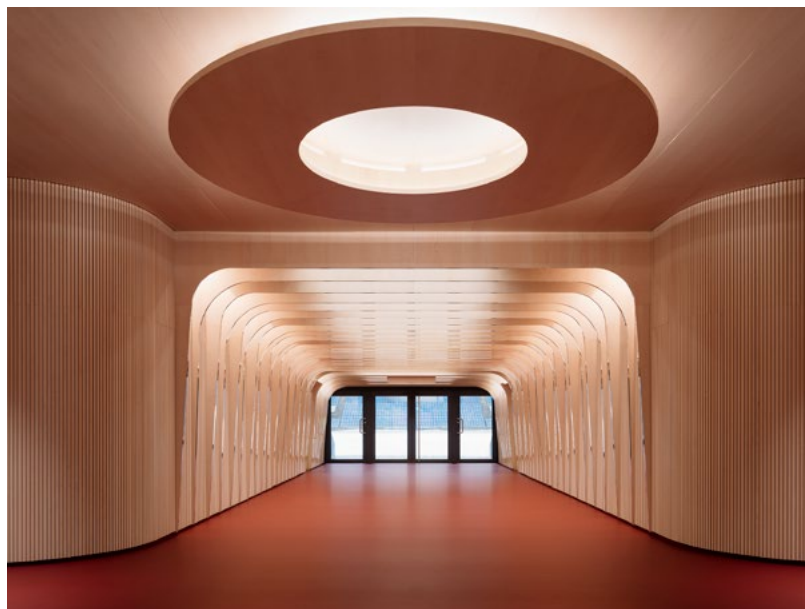
Spillertunnel. Fra garderobeanlegg ut til gressmatten.