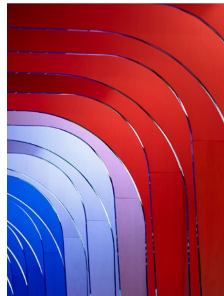
RGB-belysningen i spillertunnelen erstatter behovet for vimpler, foliering og annet materiell på kampdager og programmeres til ønsket styrke, fargekombinasjon og effekt.