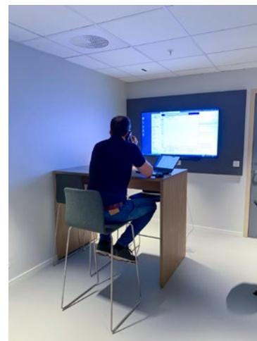
Her kan treneren studere neste motstander.

er markert med to farger som understreker areanaformen. Denne formen gjentas i en løftet himling med indirekte lys. De ønsket at garderoben skal være et rolig og samlende rom med alle støttefunksjoner rundt, slik at den viktige oppladingen til kamper skal ha fokus både for trener, spillere og støtteapparat. Alle skal kunne ha ryddige og inspirerende arealer. Eksisterende dusjanlegg ble oppgradert og en «brygge» med kaldkulp og kaldbad, viktig for