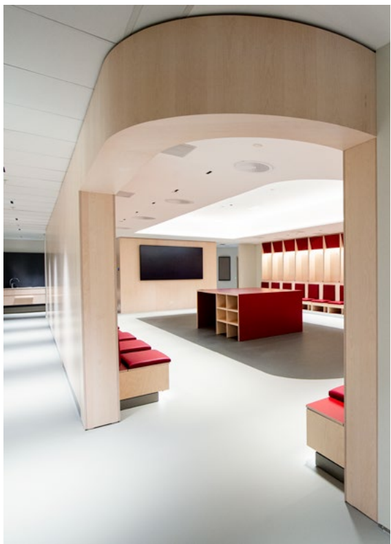
Garderobenes arenaform, som et rom i rommet, ryddet i logistikk og funksjoner.