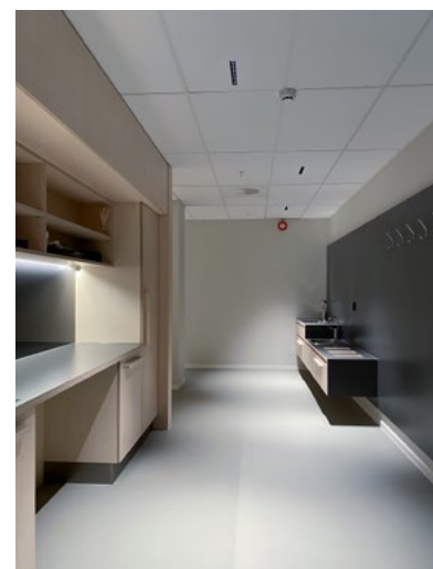
Garderoben i supportområdet med tekjøkken, støvelvask og kildesortering.