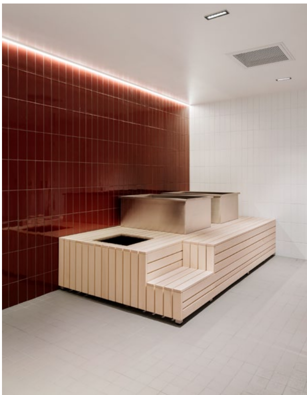
Dusj i hjemmegarderoben med kaldkulpbrygge.

→ Hjemmegarderoben med spillernisjene i arenaform for å understreke samhold og teamfølelse.