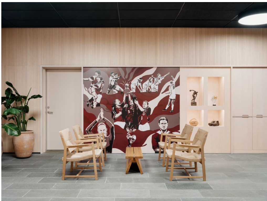
Foaje med montre for fotballhistorien.