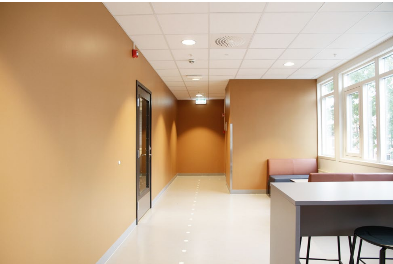
Fargelandskapet varierer fra brune-, rosa- og blåtoner, og fargekombinasjonene flyter i hverandre fra korridorene og inn til de ulike klasserommene.