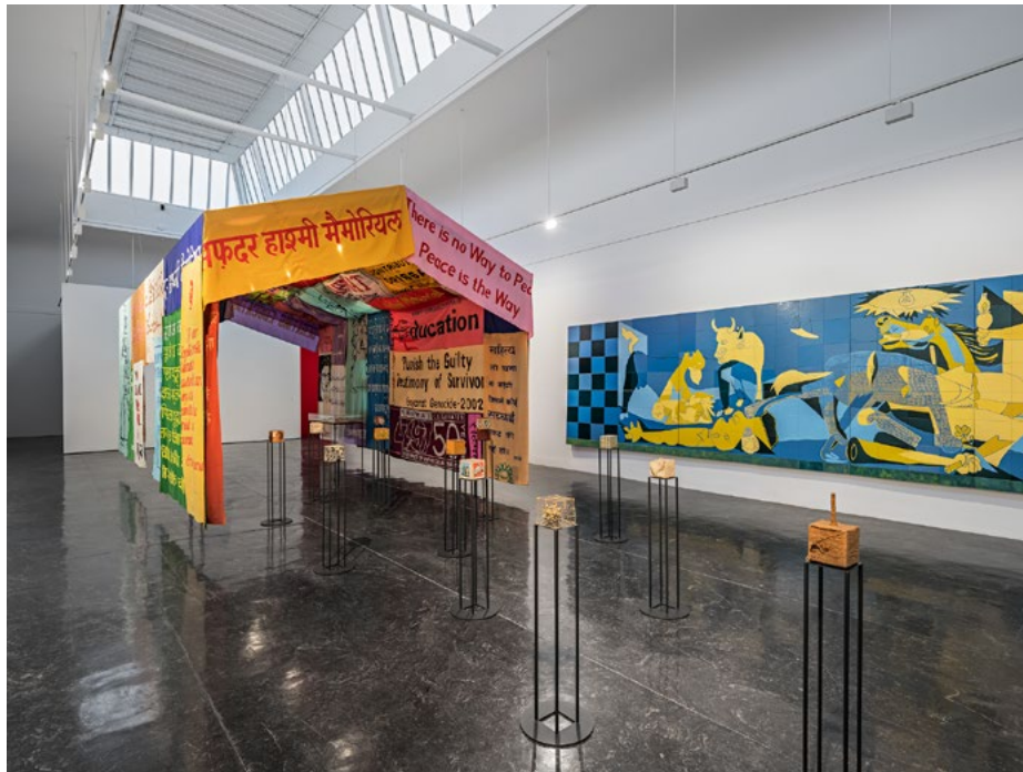
Monumentale og mindre arbeider balanserte hverandre. Beatriz González' Mural Para Fábrica Socialista til høyre, en tolkning av Picassos Guernica som ble vist på Kunstneres Hus i 1938.