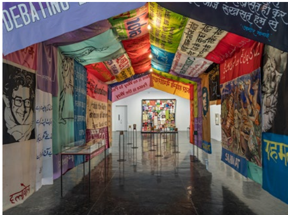
En fritthengende ramme ble designet for å vise Sahmat-kollektivets fargesprakende mobiliseringsbannere.