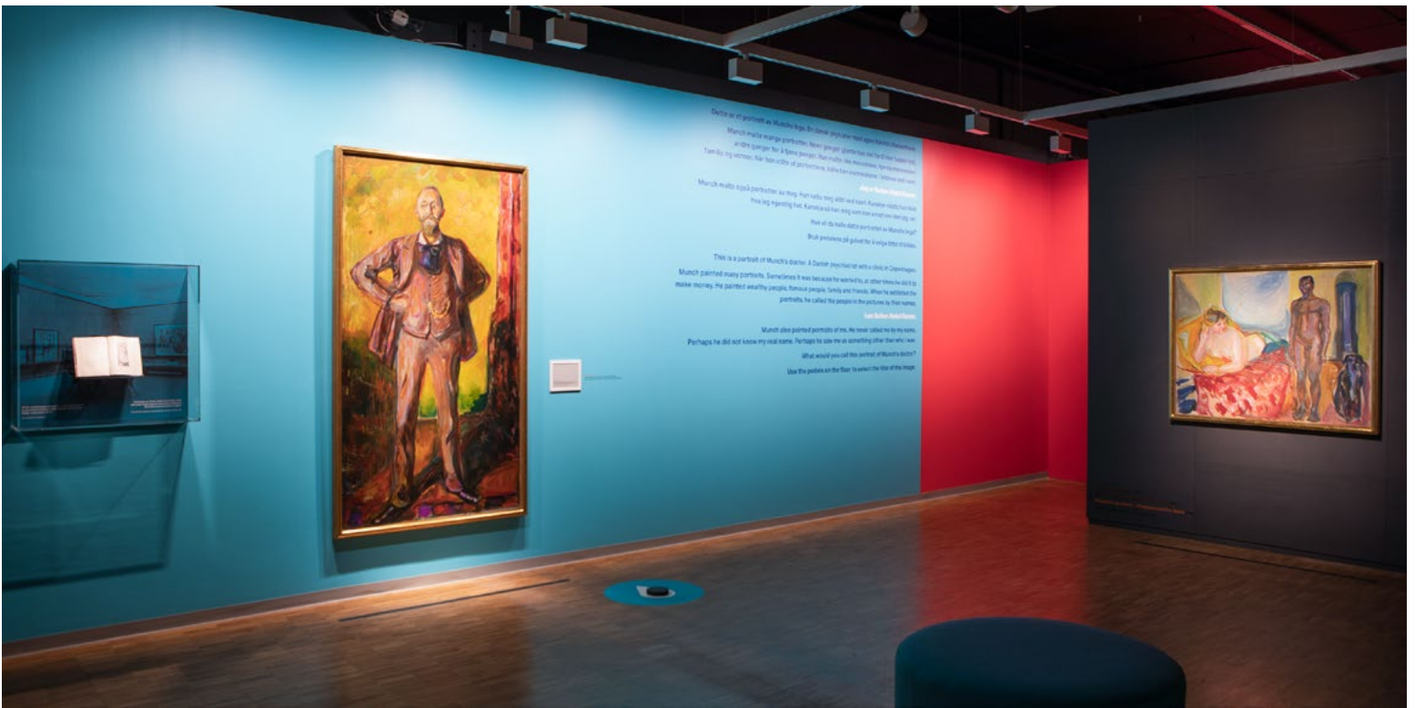
Langveggen overlappende tekst, objekter og breial typografi var i sterk kontrast til Munchs bilder.