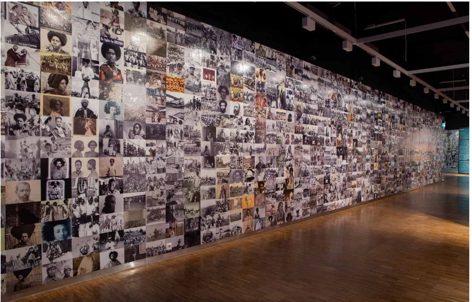
Wendimagegn Beletes bestillingsverk koblet fortid med nåtid. Intense farger reflekterte utstillingens utfordrende innhold.