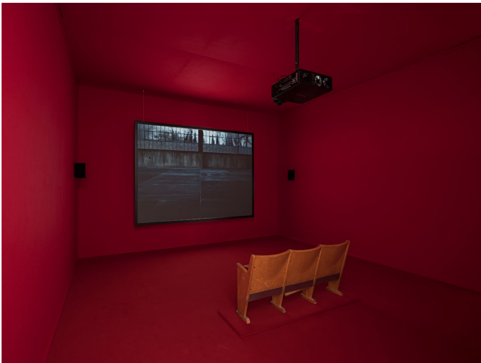
Spesialdesignet installasjonsrom for Bouchra Khalili kledd i solidaritetsrød tekstil og teppe.